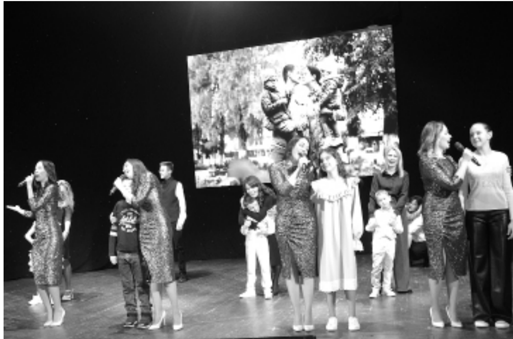
► «Миром правит любовь», – поют артисты «Синтеза» своим детям