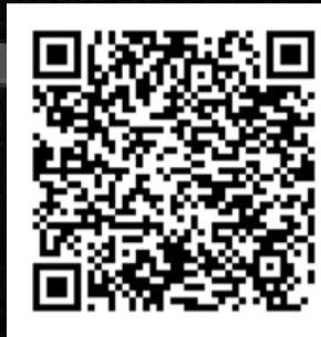
► Владимир Машков о Тобольске