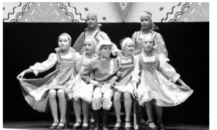
► Хореографический ансамбль «Радость»

Кстати, по заведённой традиции они дали два концерта, чтобы праздничную программу могли увидеть не только приглашённые гости, но и все желающие. А последний, как показывает практика, немало, так как на сцене нарядно со взрослыми блистают дети, на которых с удовольствием любуются их родные.