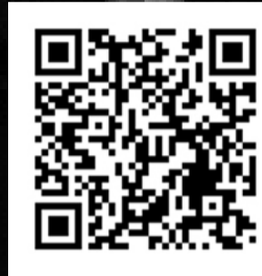
► Прогулка с Владимиром Машковым по нашему городу