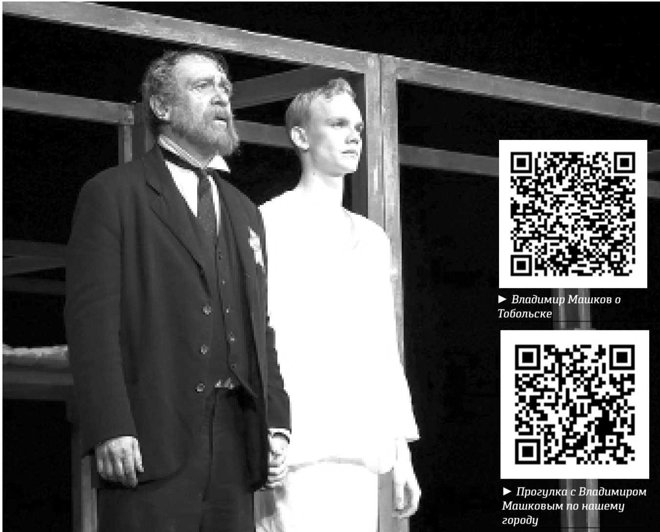
► Отец и сын Шварцы: Владимир Машков и Владислав Миллер

— Моя мама, которая жила в Тобольске в 1953 году, всегда с невероятной любовью рассказывала и о Тобольске, и о том, как, абсолютно уникальном теат-