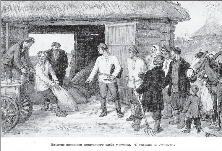
Изъятие излишков спрятанного хлеба у кулака. (С рисунка А. Лаппега.)

27 мая 1935 года приказом НКВД СССР в республиках, краях, областях были орга-