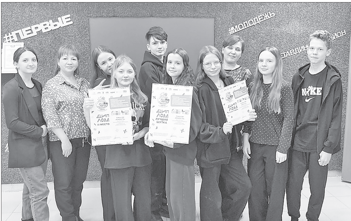
Юные КВНщики нашего района принимают поздравления от своих родителей.