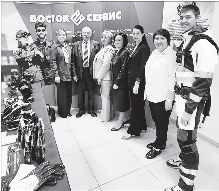
На семинаре, посвящённом охране труда на предприятиях. Демонстрация средств индивидуальной защиты.

Работодатели Нижнетавдинского района смогли более подробно ознакомиться с последними изменениями в законодательстве по охране труда, обсудили вопросы обеспечения безопасности труда, обменялись опытом в данной области. Ведь главное для всех работодателей – сделать труд своих подчинённых максимально безопасным.