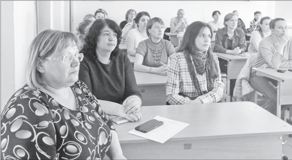
Заседание регионального родительского совета.

Рекомендации для родителей – как и о чём вести диалог с ребёнком, а также об антитеррористической защищённости и других вопросах