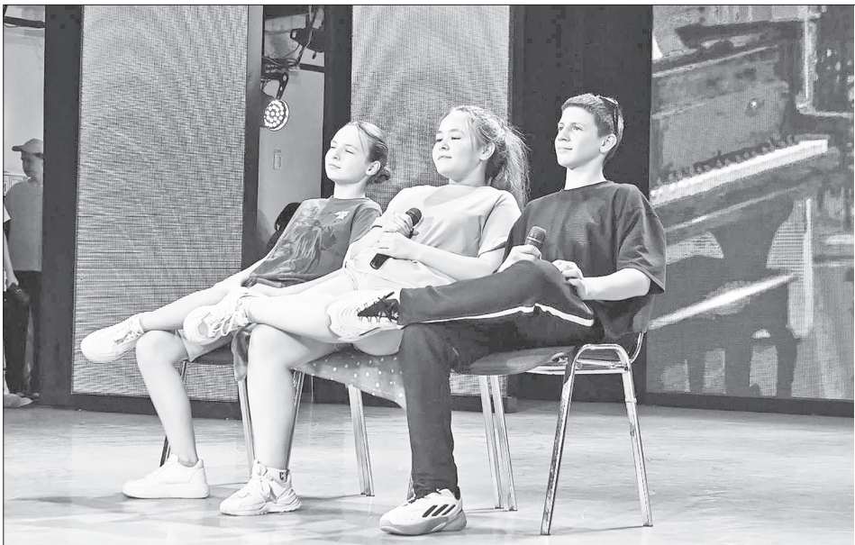
Яркие моменты выступления команды КВН «Юность» Нижнетавдинского района в полуфинале Всероссийской Юниор-Лиги.