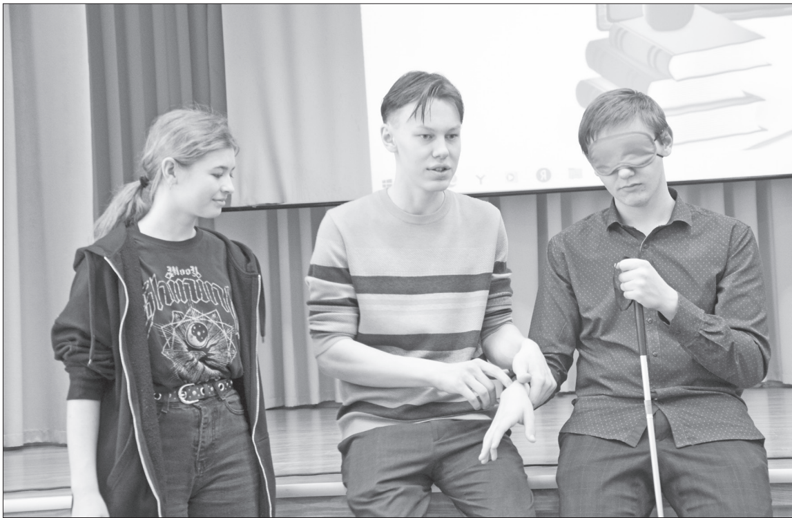
📷 Нижнетавдинские школьники пытаются донести информацию слепоглохому человеку с помощью прикосновений.

В Нижнетавдинской школе состоялась встреча, на которой старшеклассники узнали о взаимодействии с людьми с инвалидностью