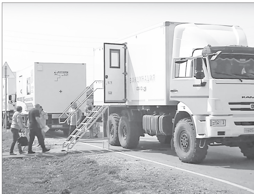
«Автопоезд здоровья» открыл свои двери жителям сёл.

недели: 1.06 – 2.06 – Киндер, Байкал, Ивашкино, Паченка, Маслянка. 3.06 – Новотроицкое, Тукман. 6.06 – Антипино, Елань, Турнаево, Вершина, Троицк. 07.06