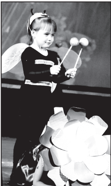
Танец «Цветочная поляна»