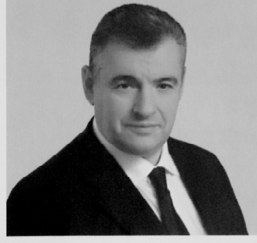
СЛУЦКИЙ ЛЕОНИД ЭДУАРДОВИЧ

1952 года рождения; место жительства – город Москва; Президент Российской Федерации; самовыдвижение