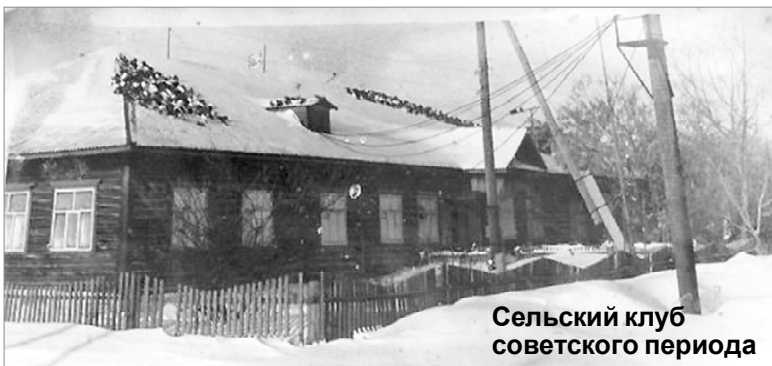
Сельский клуб советского периода