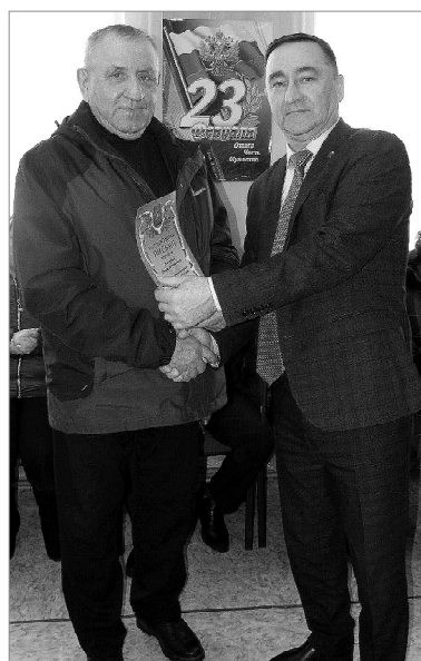
Благодарность за добрые дела