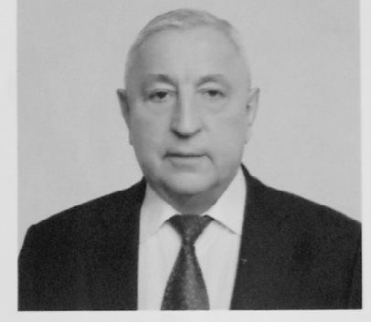
ХАРИТОНОВ НИКОЛАЙ МИХАЙЛОВИЧ

1968 года рождения; место жительства – город Москва; Государственная Дума Федерального Собрания Российской Федерации, депутат, руководитель фракции Политической партии ЛДПР – Либерально-демократической партии России, председатель Комитета Государственной Думы по международным делам; выдвинут политической партией «Политическая партия ЛДПР – Либерально-демократическая партия России»; член политической партии «Политическая партия ЛДПР – Либерально-демократическая партия России», Руководитель Высшего Совета партии, Председатель партии