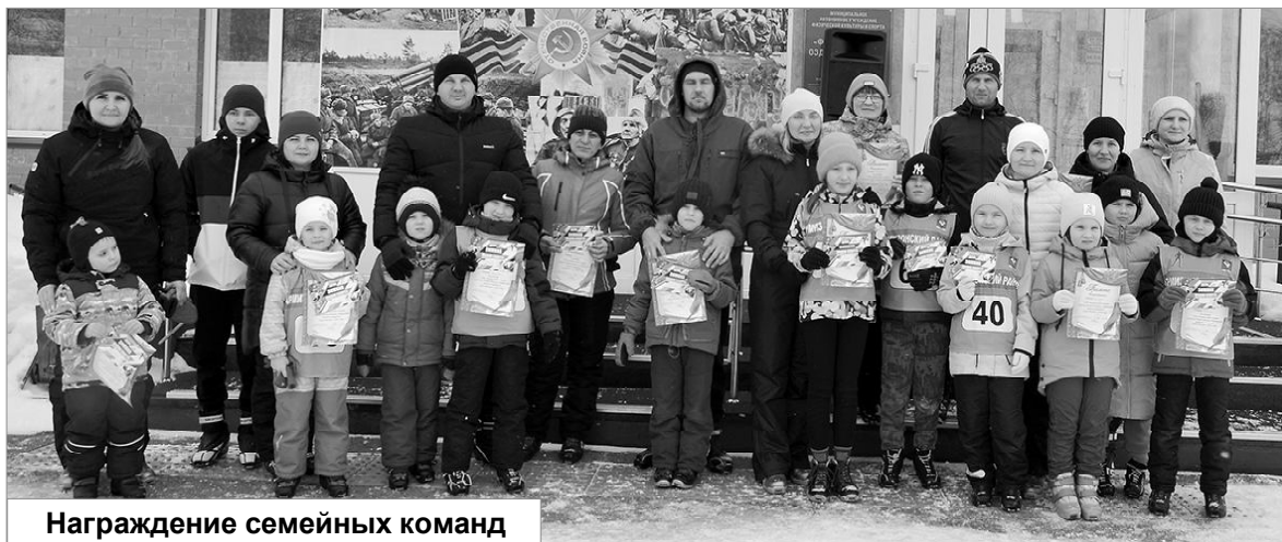
Награждение семейных команд