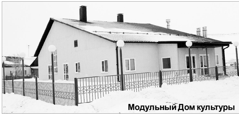
Модульный Дом культуры

Шли годы, здание клуба пришло в упадок... Его ещё в народе иронично называли «последним оплотом социализма».