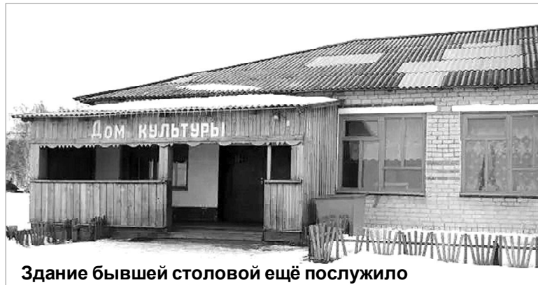
Здание бывшей столовой ещё послужило