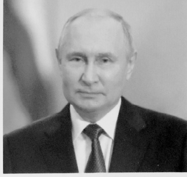
ПУТИН ВЛАДИМИР ВЛАДИМИРОВИЧ

1984 года рождения; место жительства – город Москва; Государственная Дума Федерального Собрания Российской Федерации, депутат, заместитель Председателя Государственной Думы, член Комитета Государственной Думы по бюджету и налогам; выдвинут политической партией «Политическая партия «НОВЫЕ ЛЮДИ»; член политической партии «Политическая партия «НОВЫЕ ЛЮДИ», член Центрального совета партии