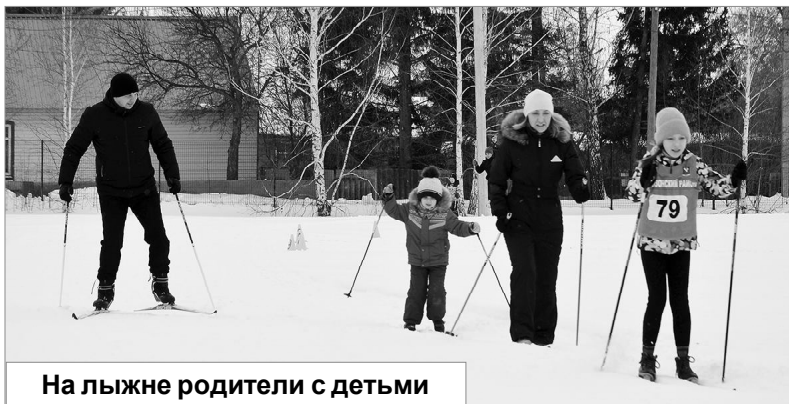
На лыжне родители с детьми