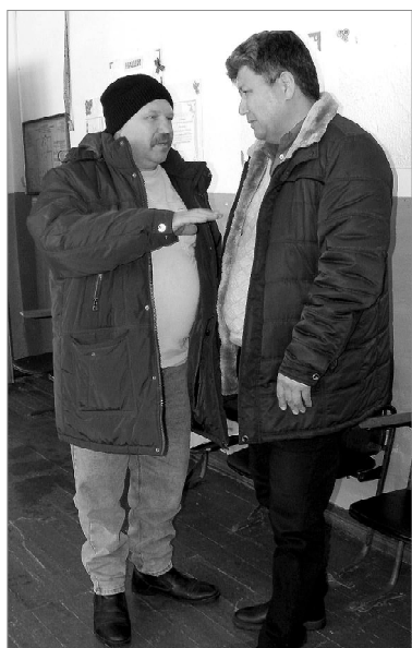
А вопросы всё-таки были