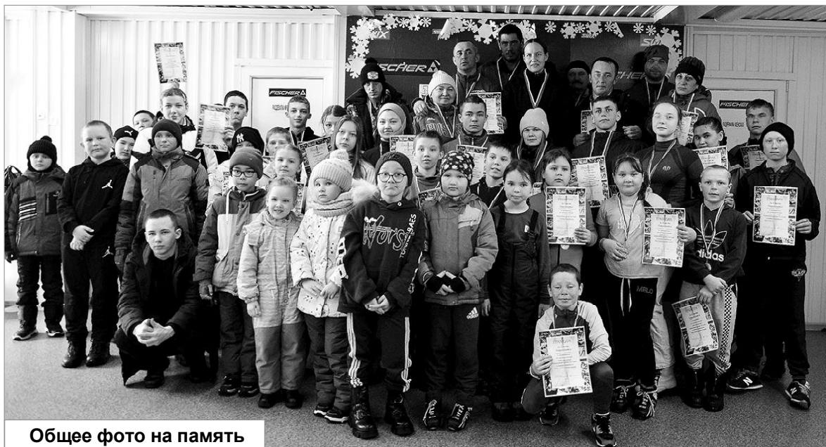
Общее фото на память