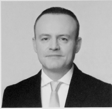
ДАВАНКОВ ВЛАДИСЛАВ АНДРЕЕВИЧ

1984 года рождения; место жительства – город Москва; Государственная Дума Федерального Собрания Российской Федерации, депутат, заместитель Председателя Государственной Думы, член Комитета Государственной Думы по бюджету и налогам; выдвинут политической партией «Политическая партия «НОВЫЕ ЛЮДИ»; член политической партии «Политическая партия «НОВЫЕ ЛЮДИ», член Центрального совета партии