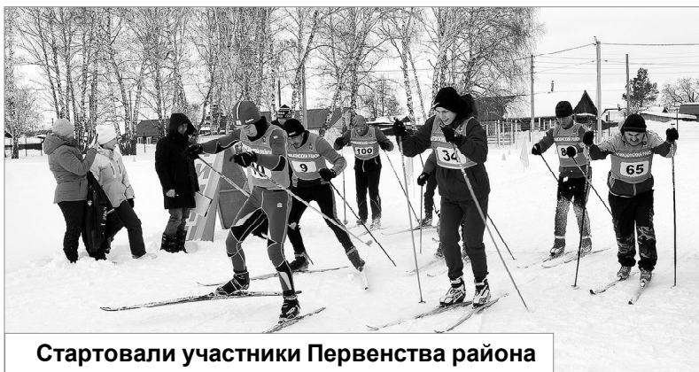
Стартовали участники Первенства района