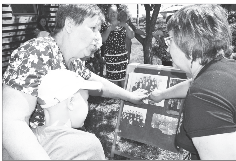
На фотографиях что ни сосед, то родственник.