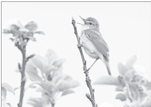
Утренние трели камышовки.