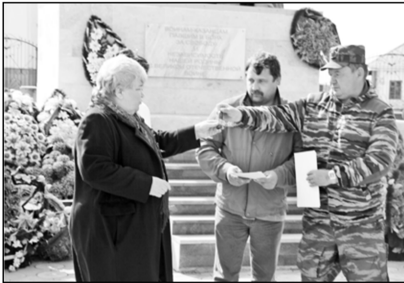
Торжественный момент – передача гильзы с землёй городов-героев

Администрация Ишимского ТПО филиала ОАО «Тюменьэнерго» – «Тюменские распределительные сети»