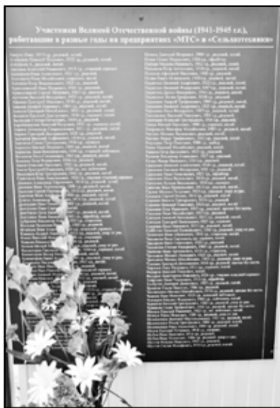
Памятные списки героев

На открытие мемориала приехали и пришли многочисленные гости. В первые ряды зрительного зала под открытым небом организаторы мероприятия усадили ветеранов труда, в том числе и доблест-