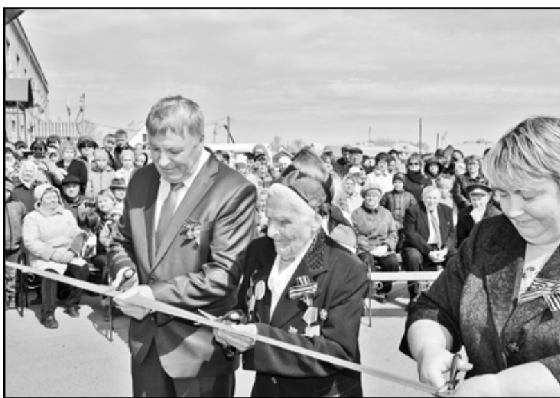
Торжественный момент перерезания ленточки

Олег ДРЕБЕЗГОВ