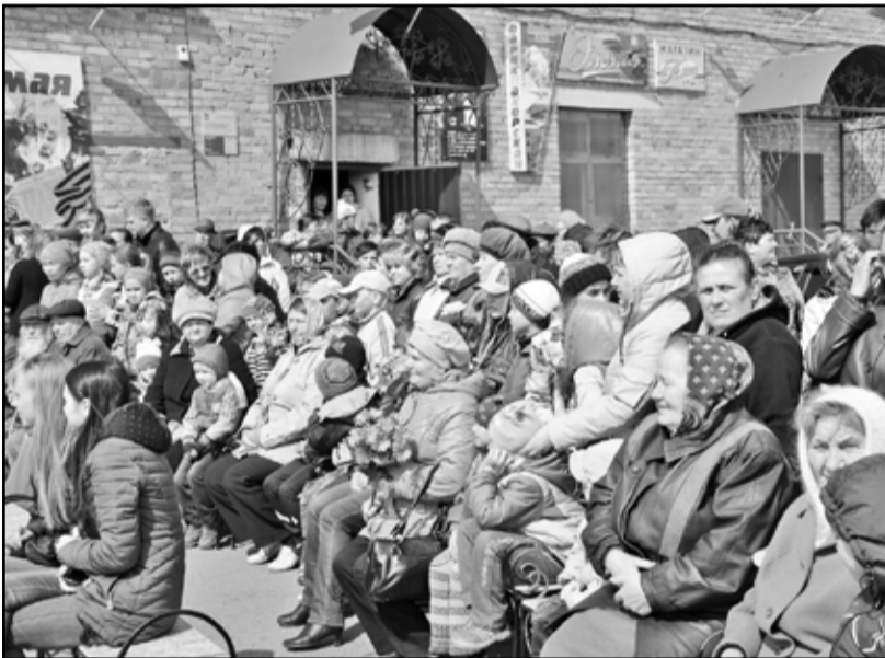
На митинг собрались представители всех поколений