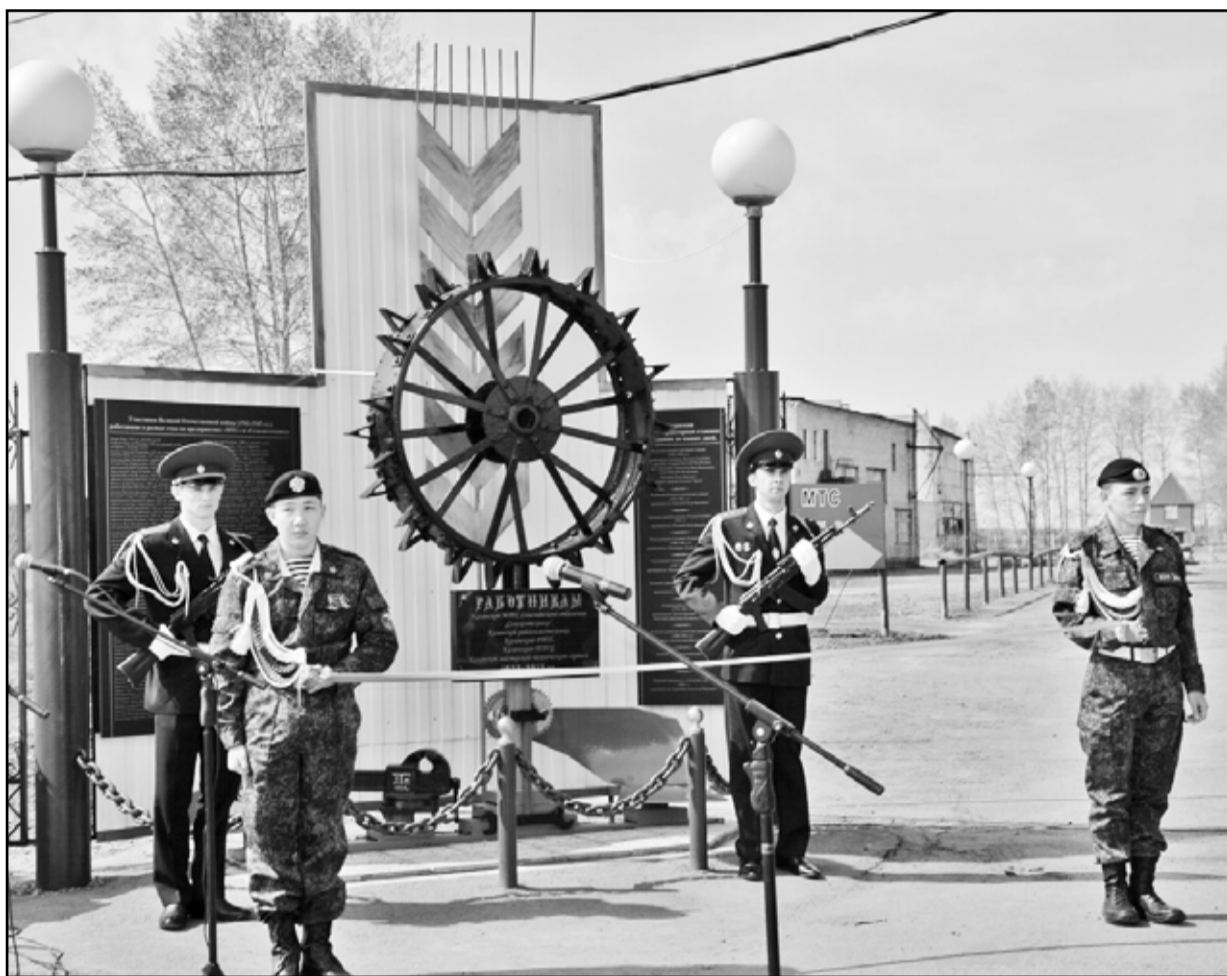
Замер у мемориала почётный караул

Второго мая у парадного подъезда Казанской МТС состоялся митинг, посвящённый открытию мемориала воинской славы и памяти.