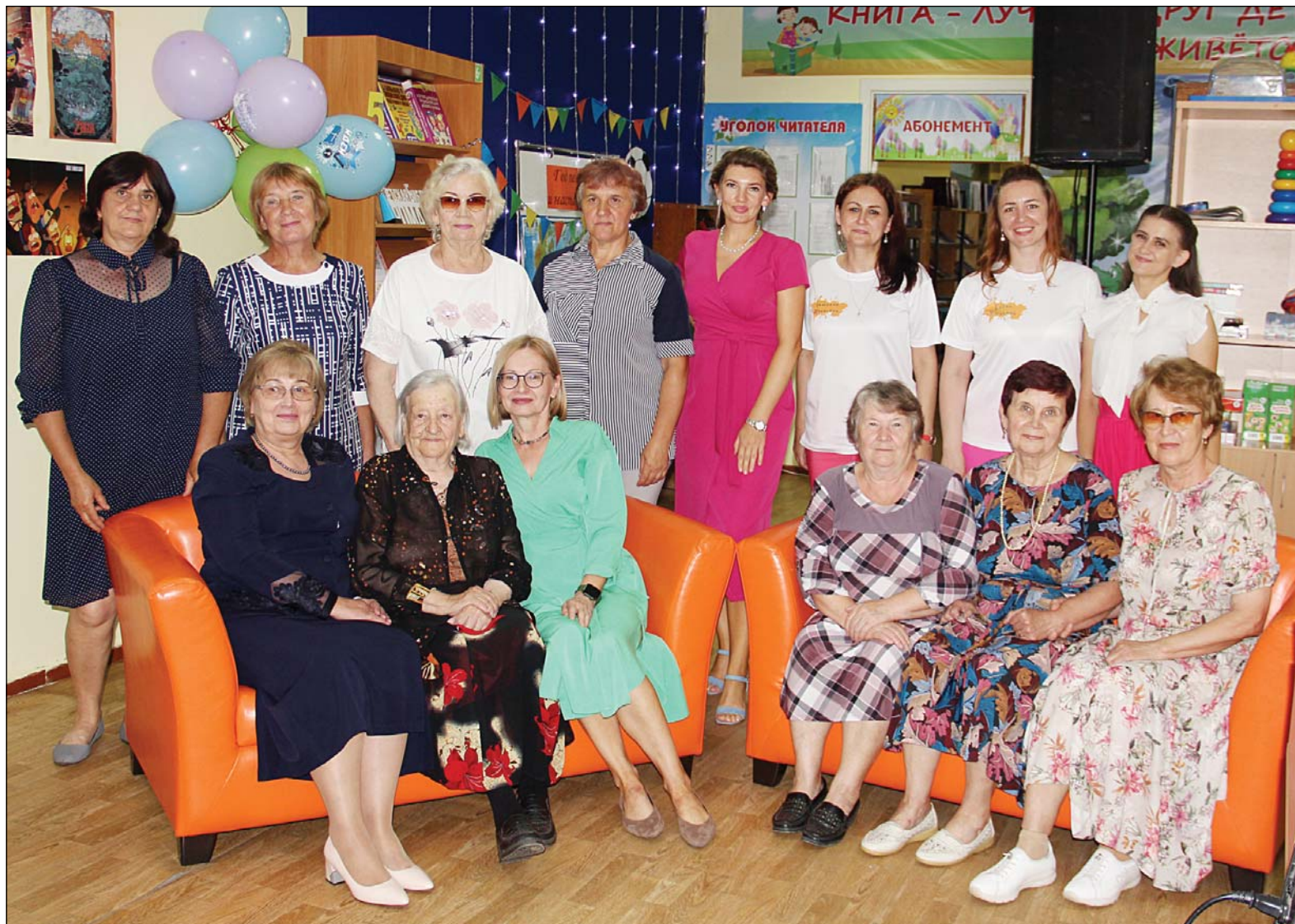
• Работники детской библиотеки не делятся на бывших и сегодняшних – это по-прежнему одна большая семья.

– В 1946 году мы переехали на улицу Вагайскую, тогда я училась в пятом классе и в первый раз пришла в библиотеку. Из обстановки того времени помню только стол, на котором лежала интересующая меня книга. Я её попросила, но мне отказали, сказав, что на неё очередь. Дождавшись своей – прочитала, и те впечатления сохранились до сих пор. Через несколько лет я пришла сюда работать. В скором времени для библиотеки потребовалось новое здание, и клубные работники, кинемеханики, специалисты сельских библиотек и мы поехали на открытые машинах в Вагайский район заготавливать лес ручными пилами и топорами. Это