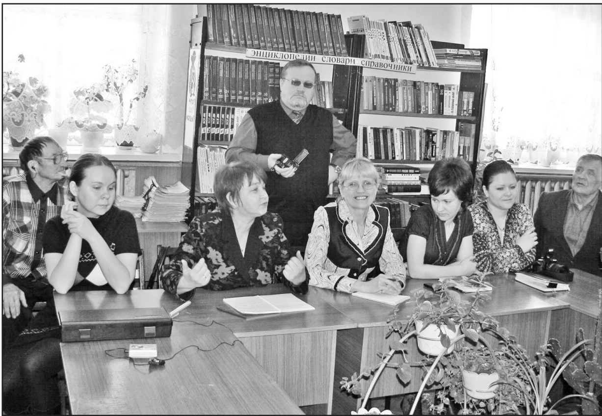
Журналисты районной газеты на встрече с жителями села Ильинки. 2009 год

Политики нынче заигрывают с прессой, снова называют её четвертой властью, обещают финансовую поддержку и прочие горы золотые. Они хорошо понимают, что самые массовые издания определяют судьбу выборов. Вот почему одни