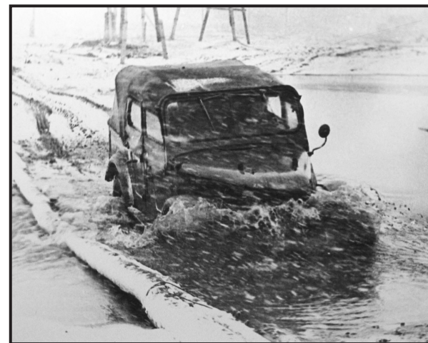
В командировку – в любую погоду. 1970-е годы

В номере газеты за 18 ноября опубликована сводка по надою молока. Сотрудниками газеты сделан вывод: «Надои молока низкие. Многие колхозы вместо повышения надо-