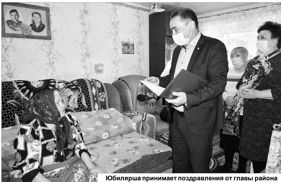
Юбилярша принимает поздравления от главы района