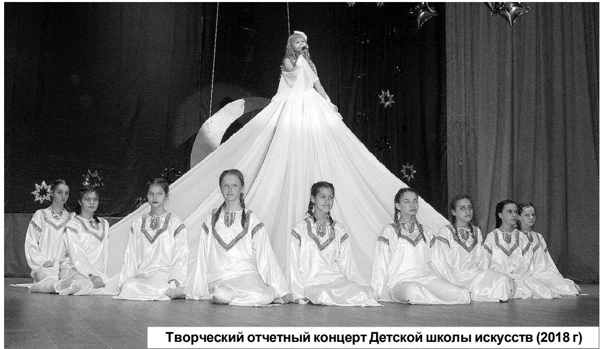
Творческий отчетный концерт Детской школы искусств (2018 г)