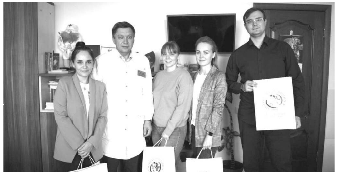
➤ Вячеслав Афанасьев с молодыми врачами