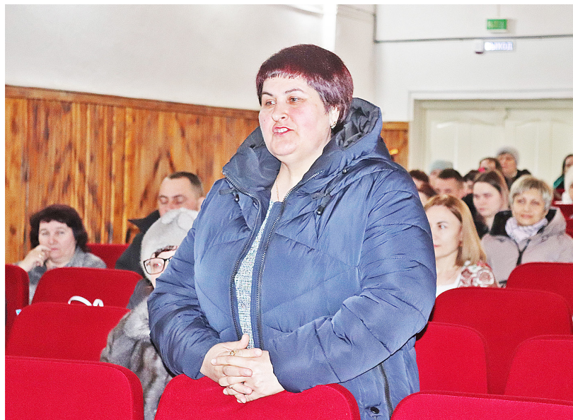
Наиболее активными на встрече были жители улицы имени Жукова