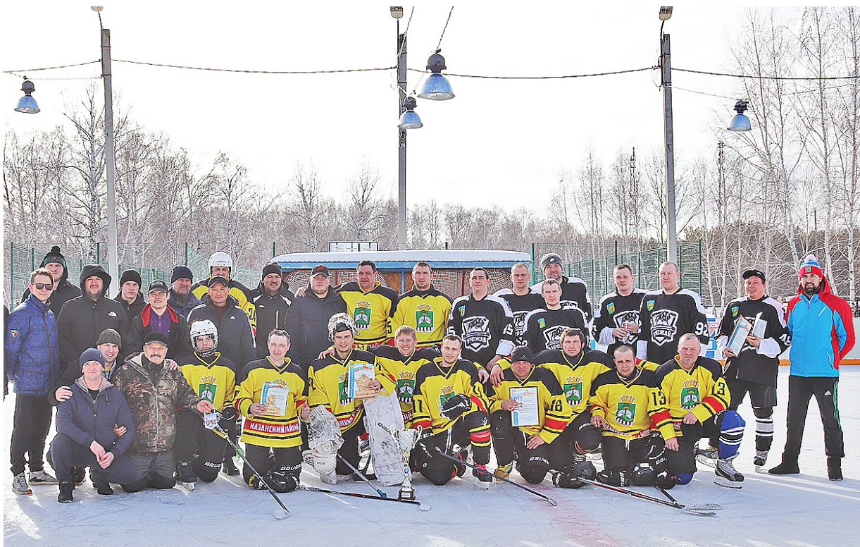
Хоккейное братство всегда дружное и сплочённое

В перерыве между матчами состоялось торжественное открытие турнира, где со словами поздравления выступили работники районного дома культуры. Они исполнили хорошую песню для поднятия настроения и бодрости духа