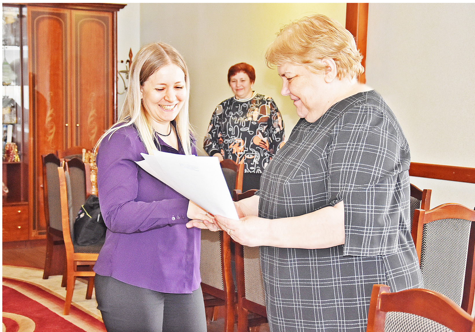
Получение сертификатов для всех участников мероприятия – счастливый, радостный момент

В администрации Казанского района молодым семьям вручили свидетельства о праве на получение социальной выплаты по двум государственным программам: «Обеспечение доступным и комфортным жильём и коммунальными услугами граждан Российской Федерации» и «Комплексное развитие сельских территорий Тюменской области».