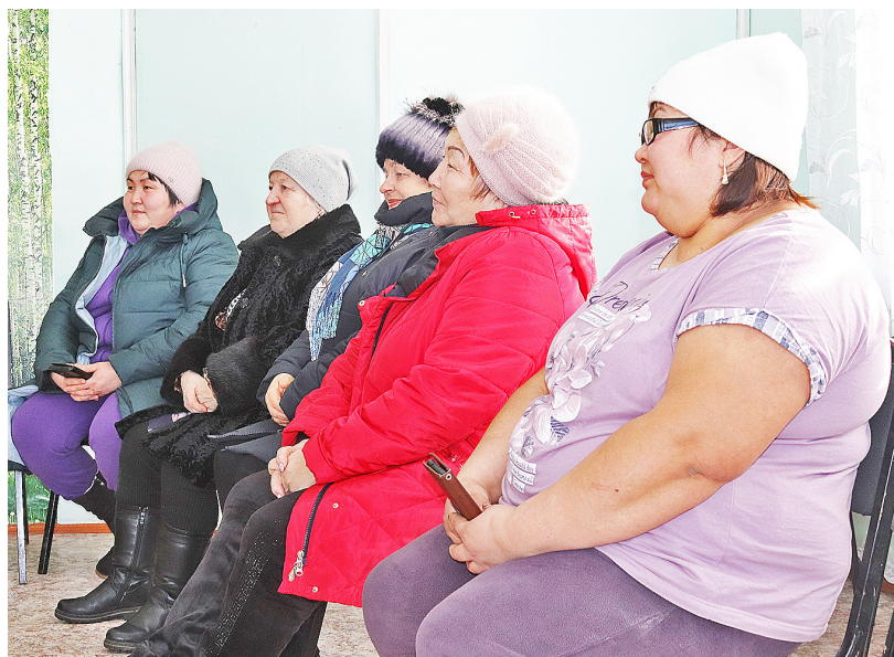
Шадринцы интересовались организацией летнего отдыха детей