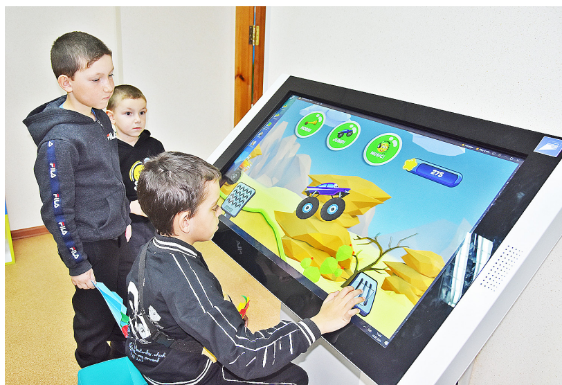
Мальчики с интересом играли на интерактивной панели