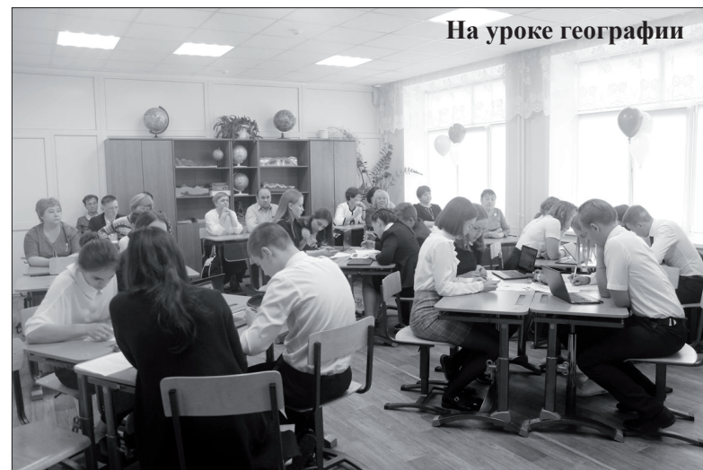
На уроке географии