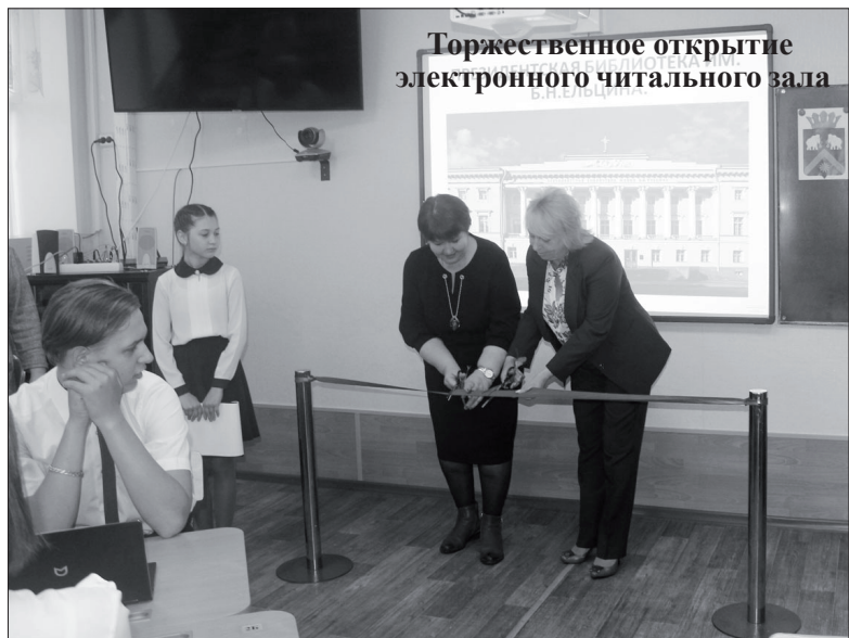
Торжественное открытие электронного читального зала

Ресурсы президентской библиотеки имени Б.Н. Ельцина стали доступны для обучающихся школ и всех жителей Абатского района.