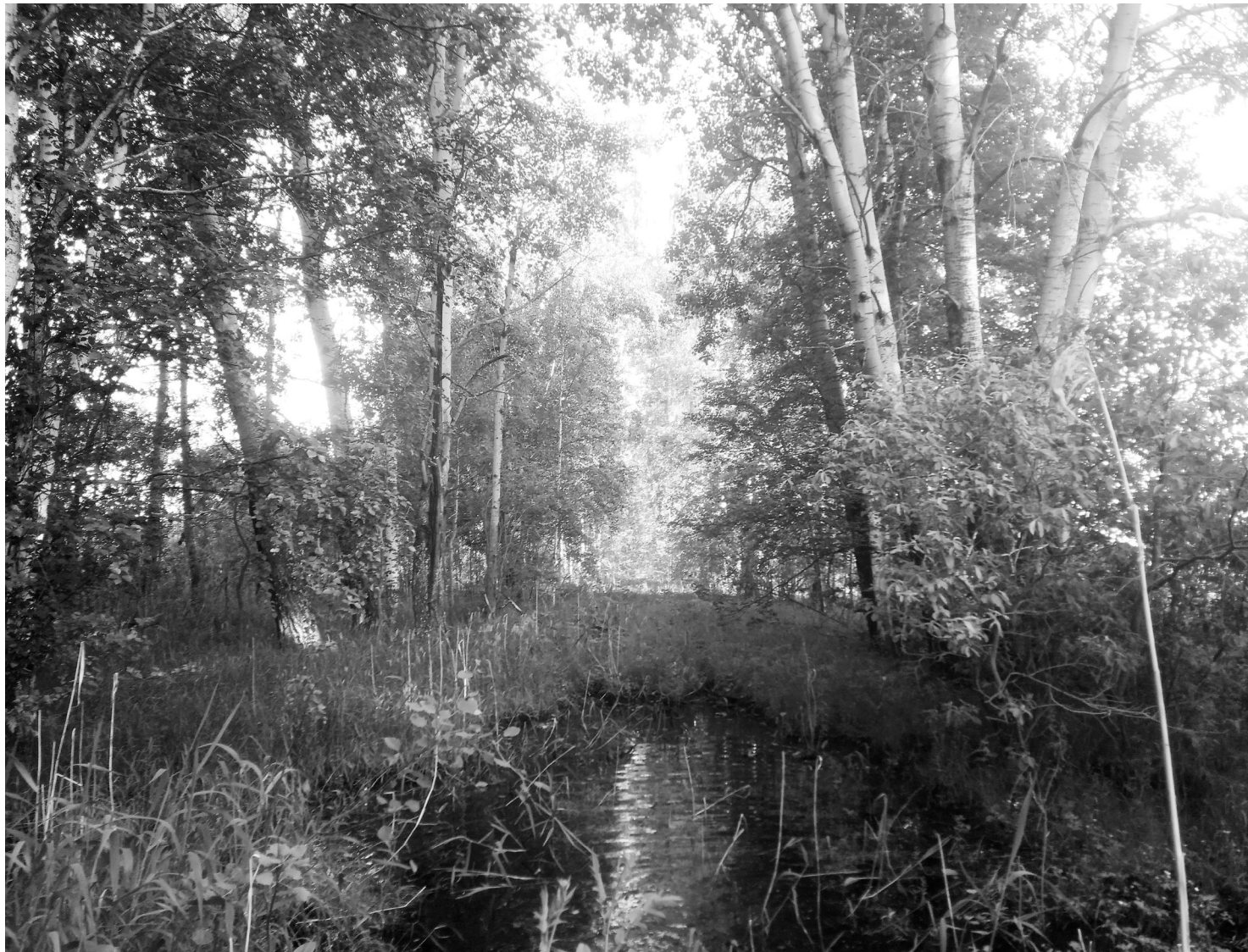
Печаль и запустение на древнем кандалном тракте.

Каторжники, переселенцы (шедшие на сибирские земли по своей воле), ссыльные, просто торговые люди, доходя до пограничного столба, прощались с Роди-