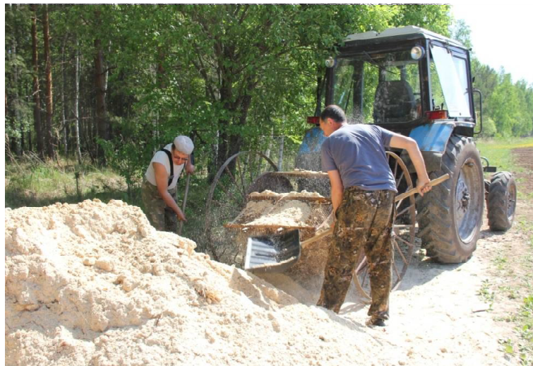
➤ Лесники грузят опил для мульчирования посевов ели