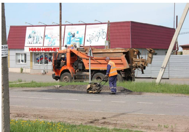
➤ На выезде из Викулово в абатском направлении

— Жители Осинки говорили, что здесь пропускается недостаточный объём воды, — пояснил Григорий Церцек. — Балаганцы тоже обращались, что в их селе не хватает воды в летний период. Из-за недостаточной производительности имеющейся станции были сбои. Потому в этом году предполагается замена станции очистки воды в Балаганах на станцию большей производительности — 10 кубометров в час. Также башня, которая находится в населённом пункте, будет демонтирована и установлена станция второго подъёма в месте существующих скважин общим