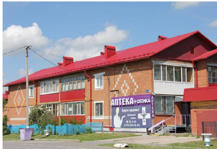
➤ Многоквартирник на улице Чапаева в райцентре

от улицы Автомобилистов до Кузнецова; улицы Автомобилистов — от Карла Маркса до «гри-