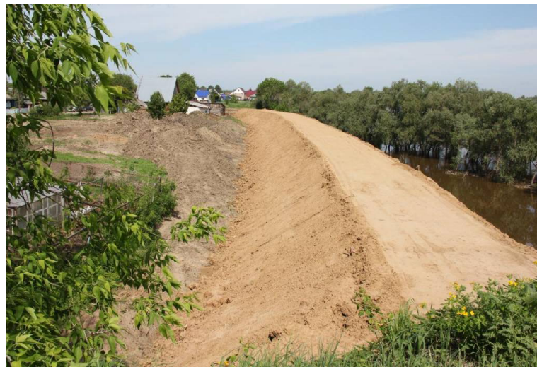
➤ Начало строительства дамбы в Викулово