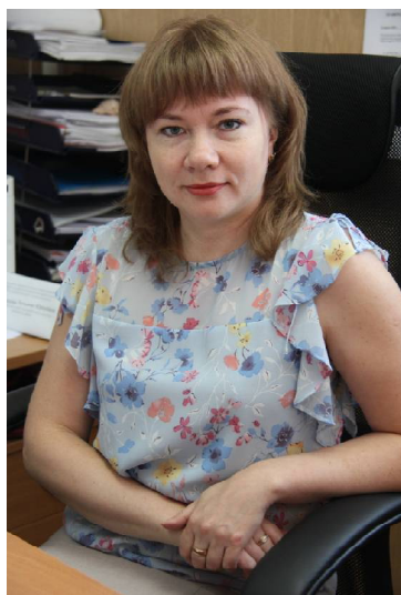
Татьяна Нестерова

– Когда и как можно подать заявление для назначения выплаты на ребёнка от 3 до 7 лет?