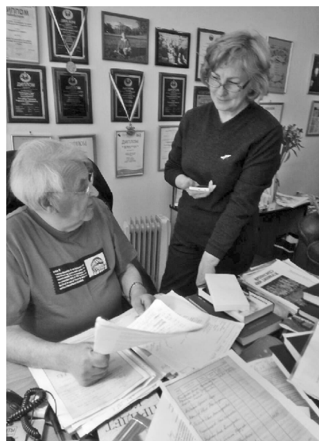
В редакции газеты «Тюменский курьер». Май 2019 г.

Мне повезло. В Тобольском и Ишимском архивах я отыскала несколько