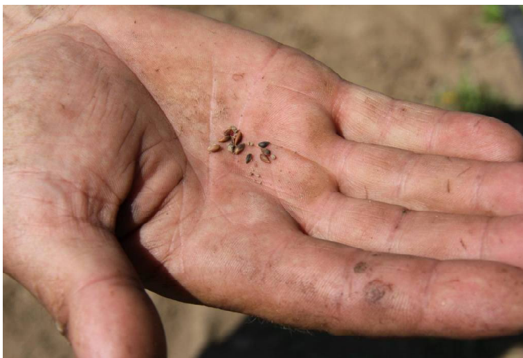
➤ Семена ели