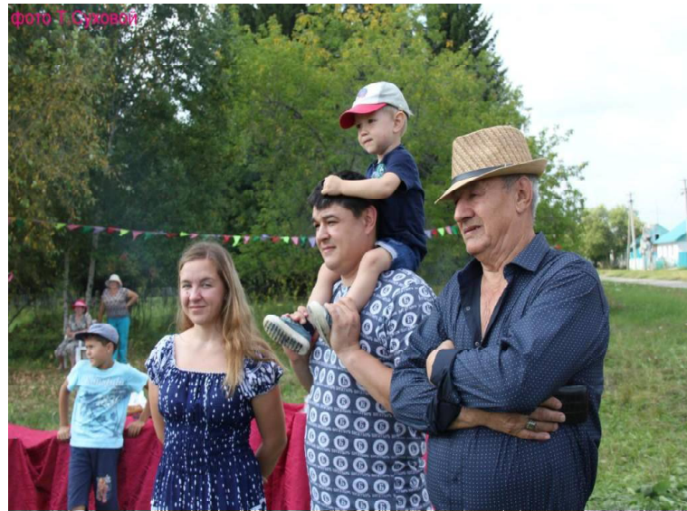
➤ На праздник пришли из разных уголков села