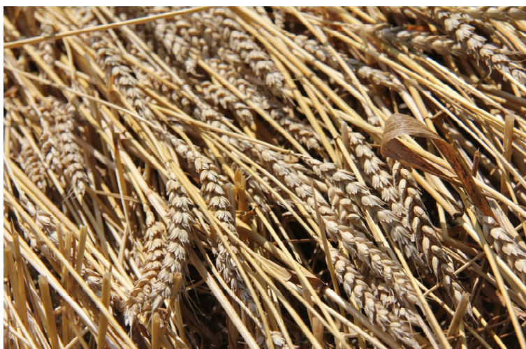
› Колос к колосу...