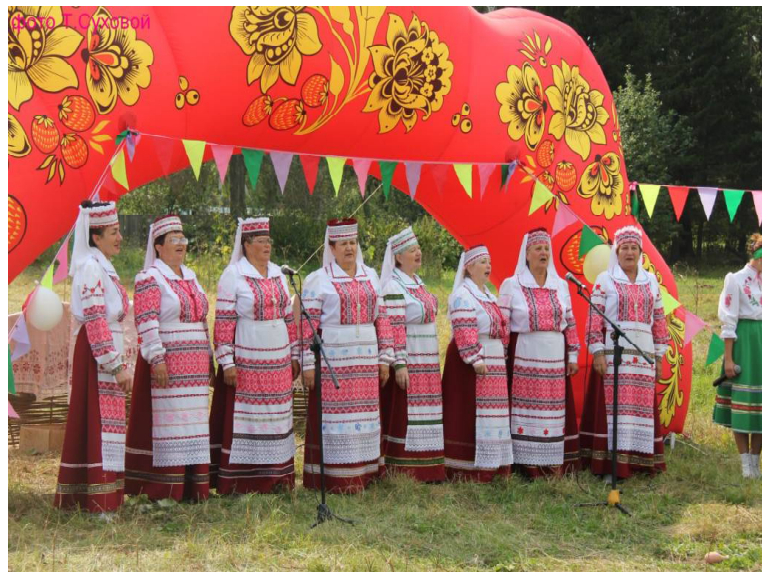
➤ Выступает фольклорный ансамбль «Россияночка».