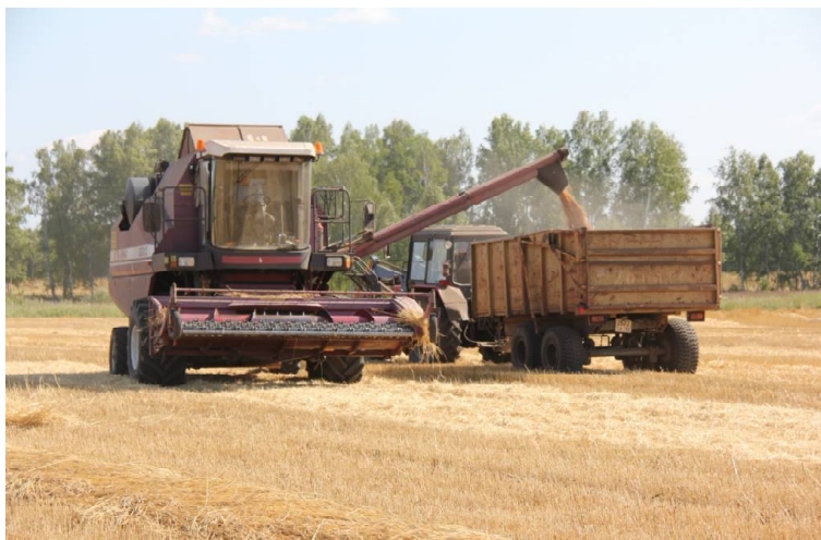
› Выгрузка зерна.