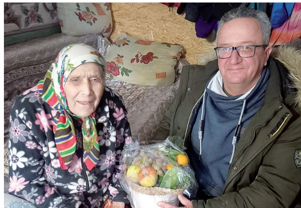
Фото из семейного архива