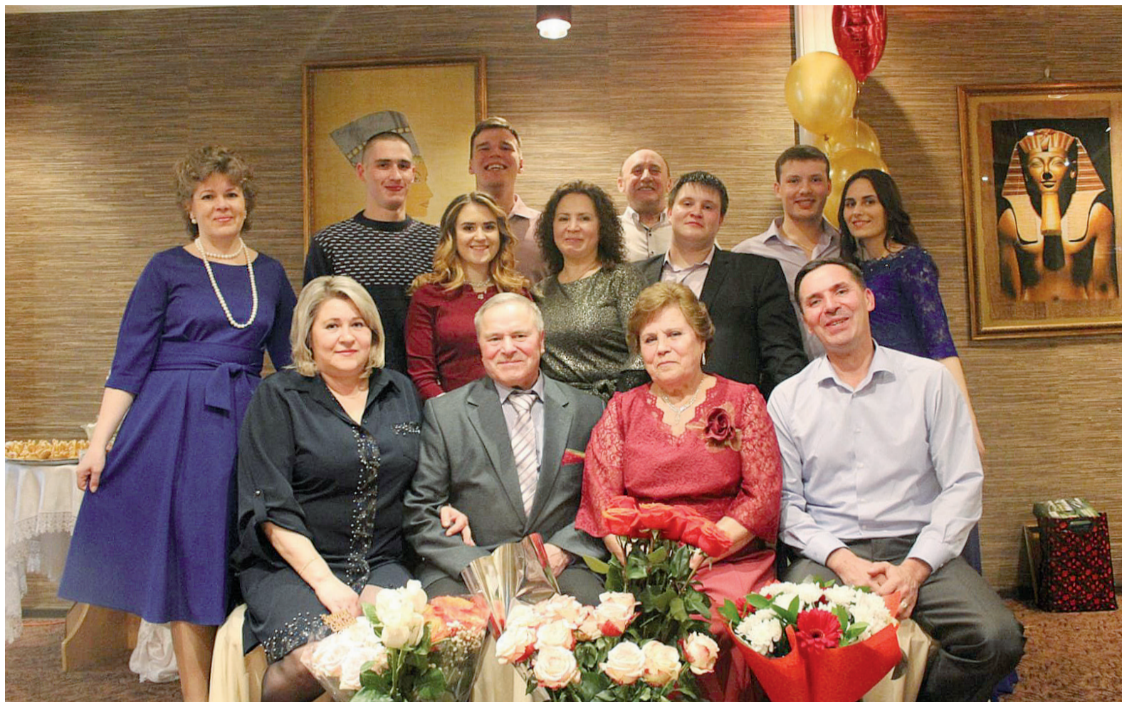
► 55-летний юбилей в кругу семьи