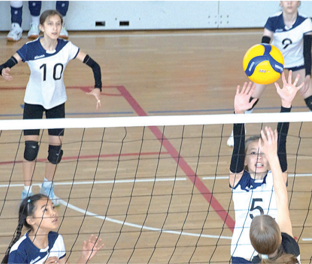
► Наши волейболистки на площадке