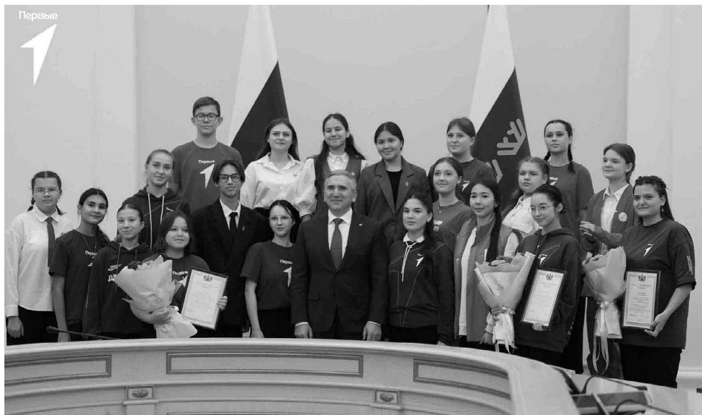
Самые активные участники первого состава детско-юношеского Совета Первых были награждены благодарственными письмами губернатора

В Тюмени прошло заседание Координационного Совета по взаимодействию с Движением Первых. В нем участвовали губернатор Тюменской области Александр Моор и представители всех муниципалитетов.