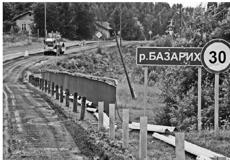
➤ Дорожные работы в Базарихе. Лето 2019 г.

длинная улица Базарихи в полном порядке. Здесь и подъезды к каждому дому оборудованы, и канавы прочищены, и обочины выровнены. А параллельно с ремонтом дороги мы решали ещё одну проблему: из-за ветхости тополей во время непогоды периодически обрывались провода линии электропередачи, мы спилили старые деревья и избавили сельчан от такой угрозы. Теперь жители довольны, с лета не поступало ни одной жалобы на