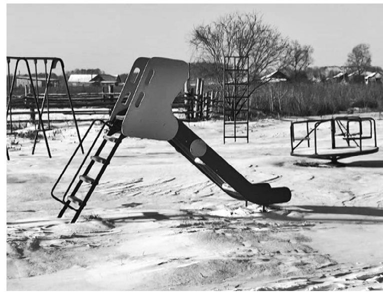
➤ Игровая площадка в Бородино

— Мы к этому вопросу подошли рационально, ведь денег немного, а полезное хочется сделать и для малышей, и для подростков. Поэтому от песочницы, за которой должен вестись санитарный надзор, мы отказались. Но ради баскетбольного кольца. Оно и прочнее, и ухода требует меньше, и пользы ребятишкам при-