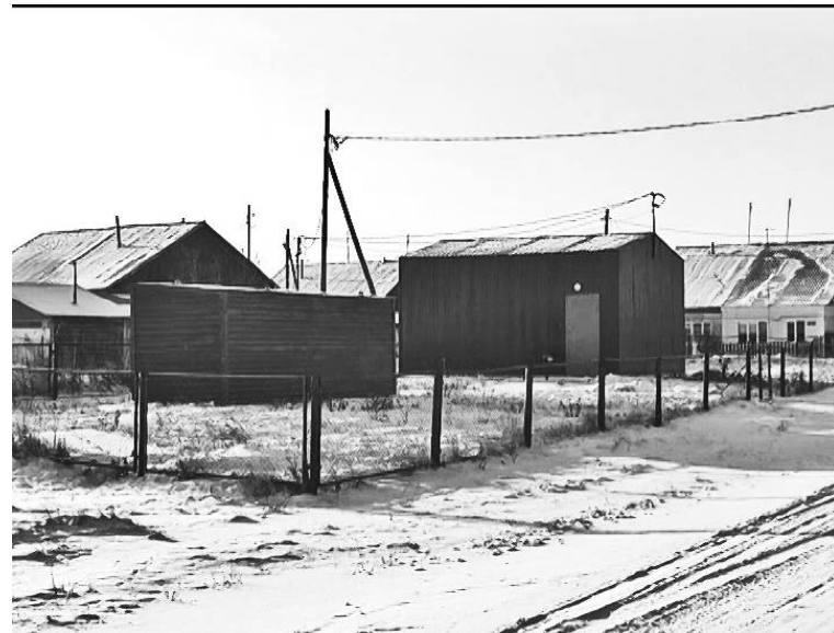
➤ Водозаборная станция второго подъёма, с.Коточи́ги

Ещё одно важное сооружение появилось в Коточигах