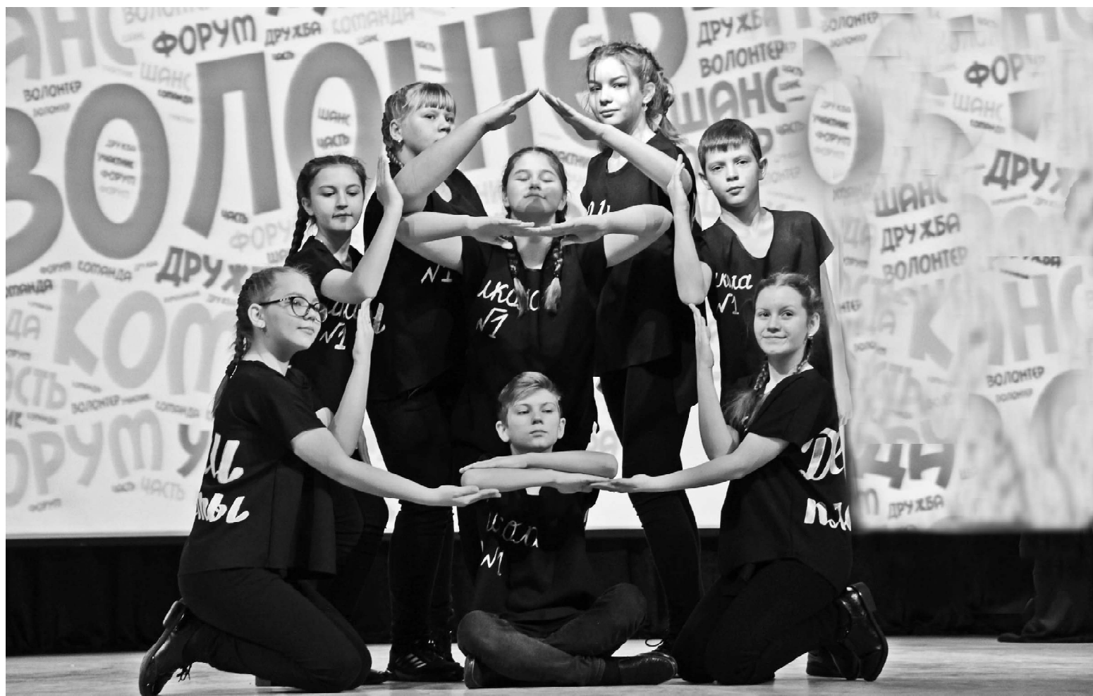
«Дети планеты» из Викуловской школы №1 подошли к выступлению неординарно