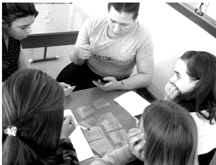
➤ Студенты техникума играют в правовую игру

На исходе часа пришло время подводить итоги, и пусть одна команда набрала немного больше баллов, чем вторая, это не самое главное. Главное, что благодаря таким мероприятиям ребята, которые сейчас особенно легко поддаются негативным влияниям, стали более «подкованы» в правовом плане. И, очень