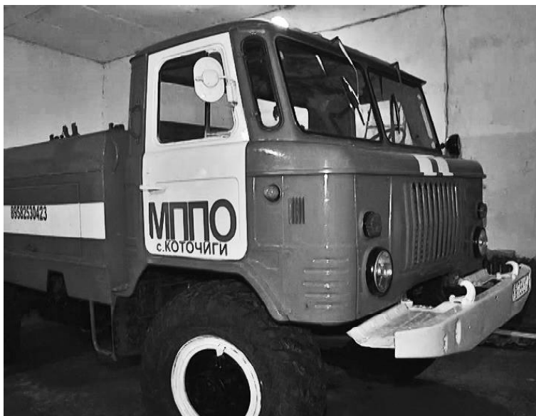
➤ Пожарный автомобиль Коточиговского поста

С 24:00 до 5:00 освещение отключалось. За счёт этой экономии мы смогли купить детскую площадку в Бородино и провести работу по благоустройству (спилить аварийные тополя).