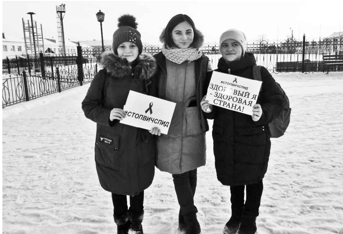
Волонтёры «Направления Плюс» во время акции «Скажи жизни «Да!»

нику. До «бронзы» не хватило 0,5 очка, а в результате — четвёртое место. Обидно.