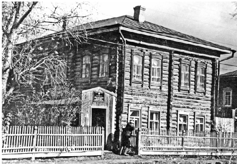
» Старое здание Викуловской милиции