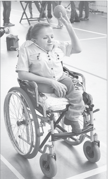
Игра в бочке

Завершилось мероприятие вручением дипломов и медалей сильнейшим командам. И не важно, кто выиграл, а кто проиграл. Ведь само участие для многих из спортсменов - уже победа. Победа над собой.