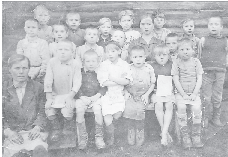
Начальная школа в деревне Трисан, 1944 г.

1968-й стал последним годом жизни деревни. Дома были разобраны и перевезены в Ивановку, а на хуторе ещё долгое время располагалась летняя дойка для коров, электричество к которой всё-таки подвели - в 70-м.