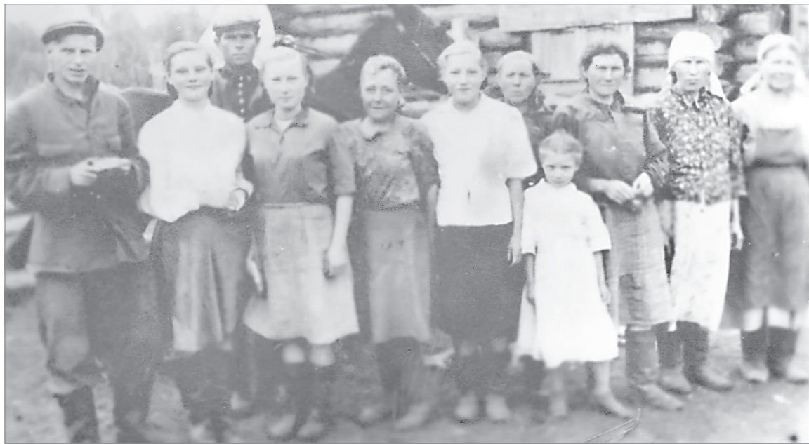
Хуторская бригада, 1954 г.