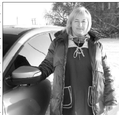
Хозяйка большого подворья