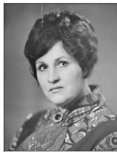
Как молоды мы были