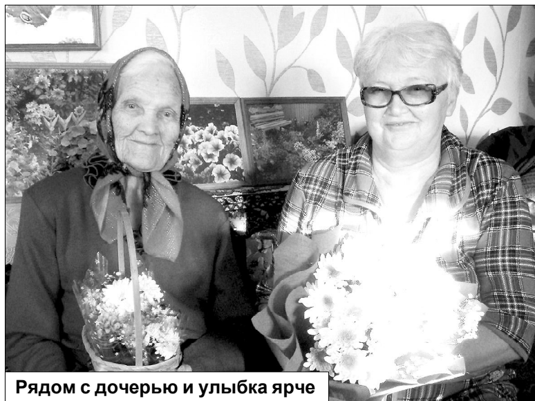
Рядом с дочерью и улыбка ярче