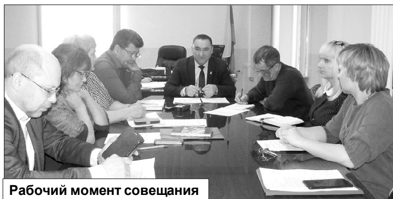
Рабочий момент совещания