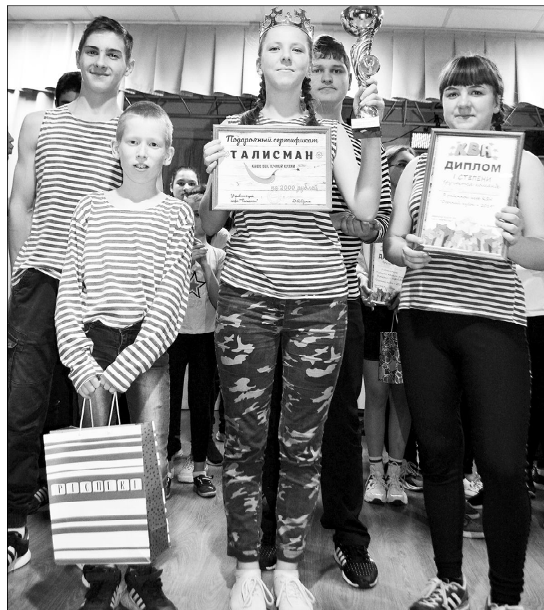
Победа принесла кубок, диплом и поход в кафе