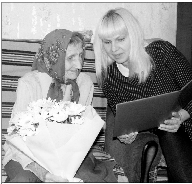
«...Неужто сам президент поздравил?!»