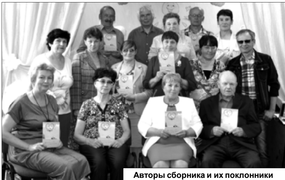
Авторы сборника и их поклонники