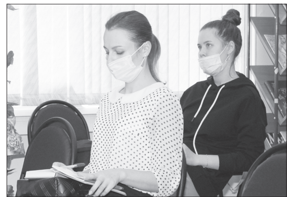
Представленная информация полезна тем, кто работает в сфере туризма и культуры