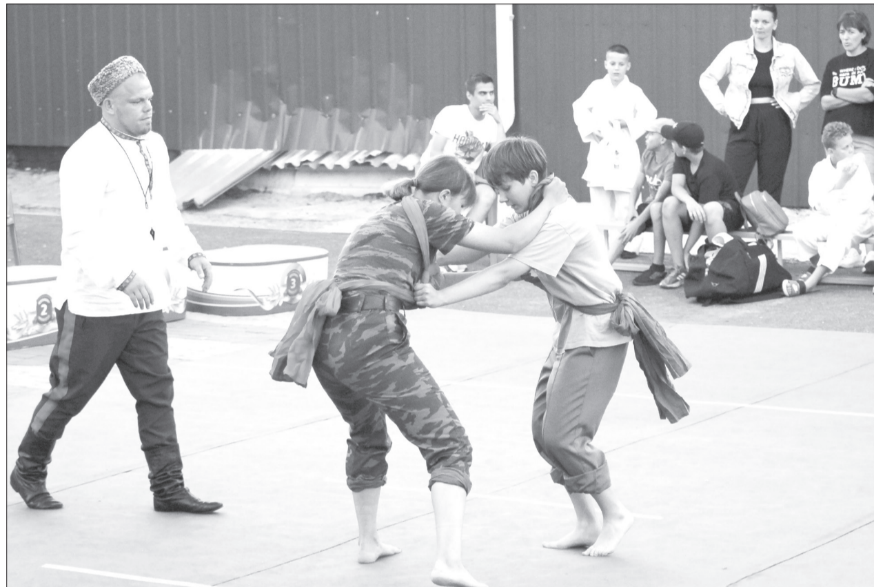
Больше всего удивили школьницы, пожелавшие участвовать в состязаниях

Участники первого фестиваля единоборств соревновались за живого гуся