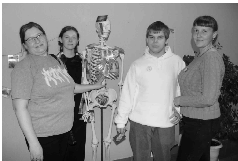
Мамы и дети с удовольствием вспоминали свои познания в анатомии