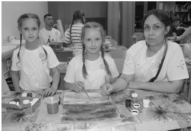
Техника правополушарного рисования направлена на развитие творческих способностей и воображения