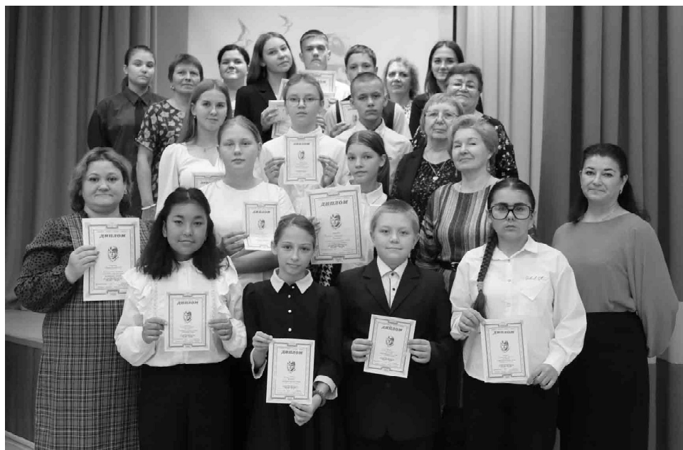
Участников конкурса объединила любовь к творчеству великого русского поэта Сергея Есенина