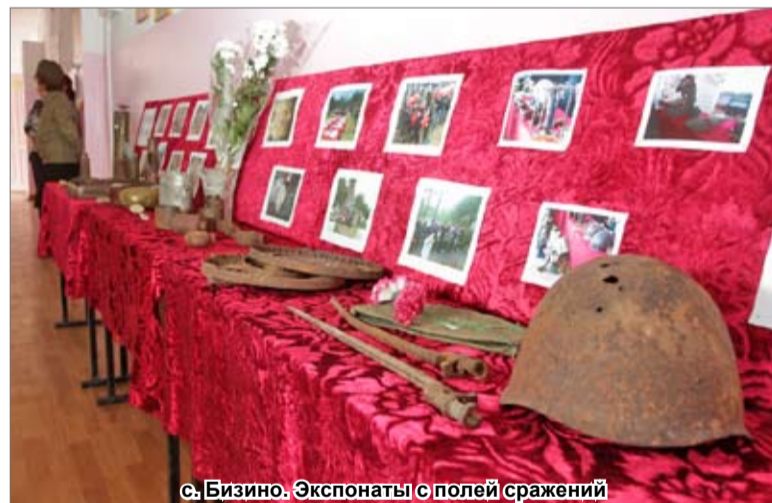
с. Бизино. Экспонаты с полей сражений