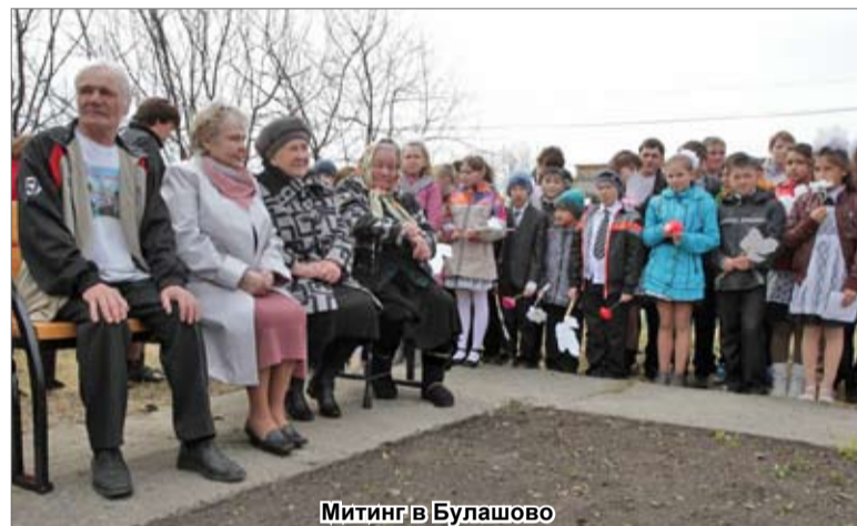
Митинг в Булашово