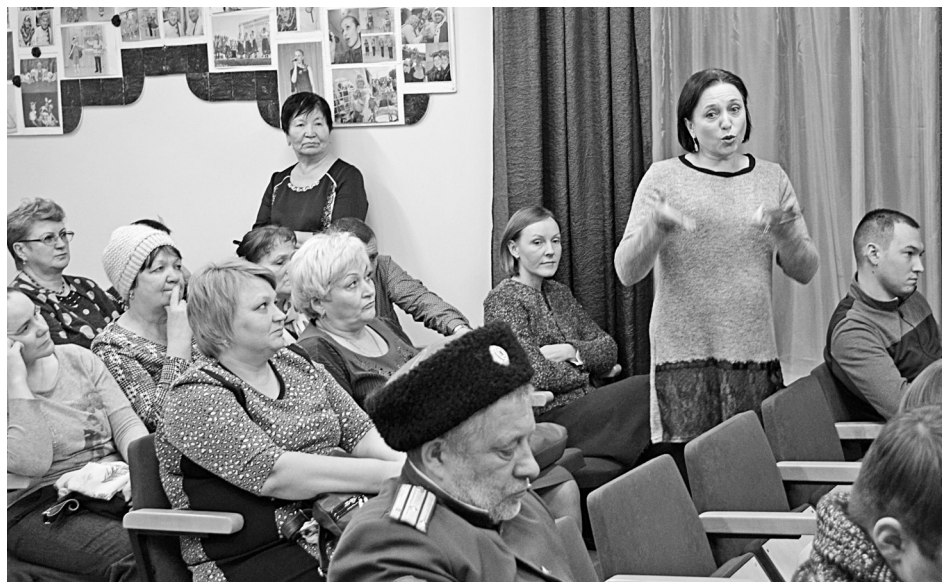
На депутатов «сыпались» не только вопросы, но и слова благодарности.

культуры состоялся социальный всеобуч «Гипертония, стоп!». Как уже было отмечено на страницах нашей газеты, медицинские сёстры Тюменской области стали победителями гранта Президента РФ и теперь они разворачивают свою деятельность, проводя семинары и всеобучи в различных образованиях. Основной задачей данного мероприятия стало обучение сельского персонала методикам профилактики и лечения заболеваний сердечно-сосудистой системы. Также любой желающий мог посетить всеобуч.