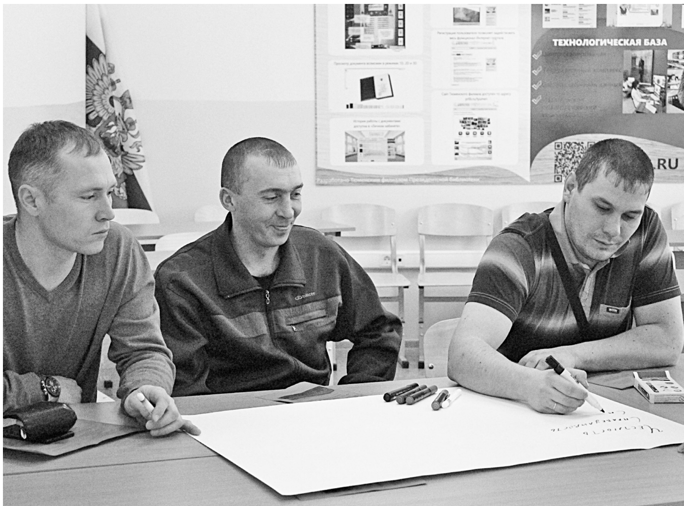
Работа в группах. Отцы составляют послание-пожелание своим детям.