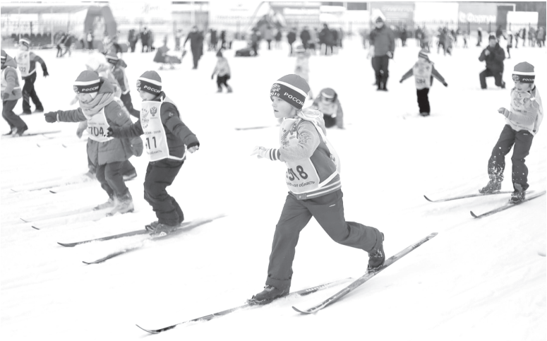
Физкультурно-спортивное направление внеурочной занятости в 2018 г. выбрали 6 375 детей