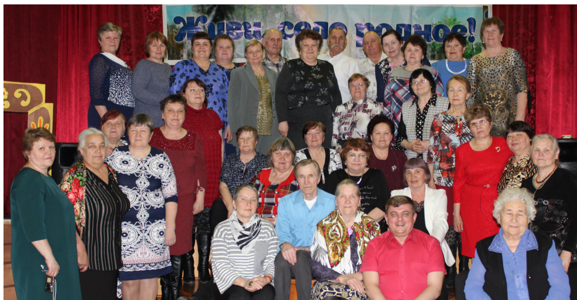
Участникам встречи будет приятно найти себя через много лет на этой фотографии.