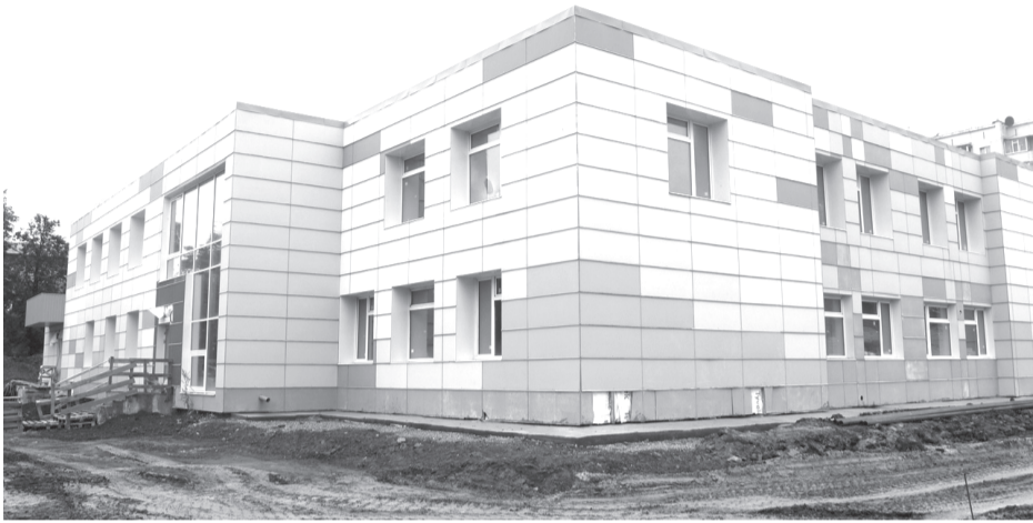
Учащиеся лицея получат новые классы и помещения для спорта и творчества