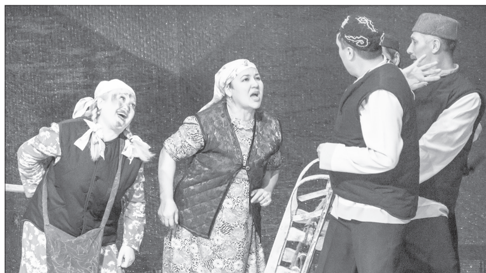
В основе номеров коллектива всегда сценки из реальной жизни. Артисты обыгрывают истории, рассказанные их родителями, бабушками, дедушками и односельчанами