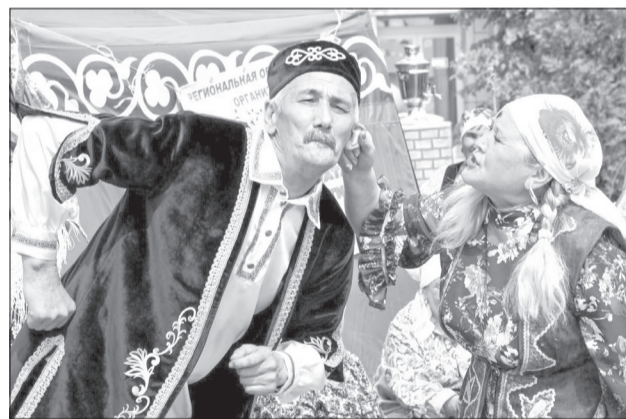
Ансамбль часто выступает на открытых площадках. Это добавляет действу правдоподобности