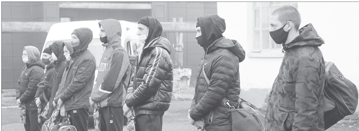
Как признаются ребята, настроение у них боевое, идут служить с охотой