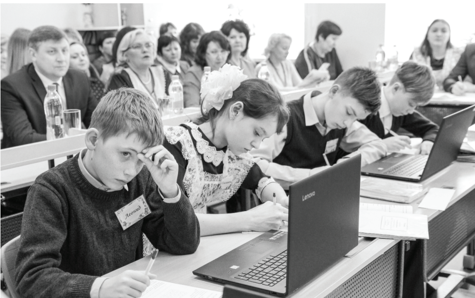
Ученикам Тоболовской средней школы понравился весь цикл конкурсных мероприятий.