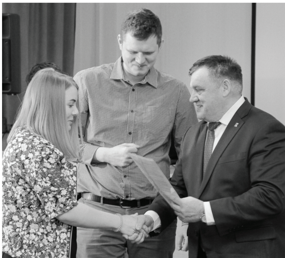
Глава города Фёдор Шишкин поздравил молодые семьи.

Глава Ишима Фёдор Шишкин подчеркнул: по реализации программы «Молодая семья» Ишим – второй город после об-