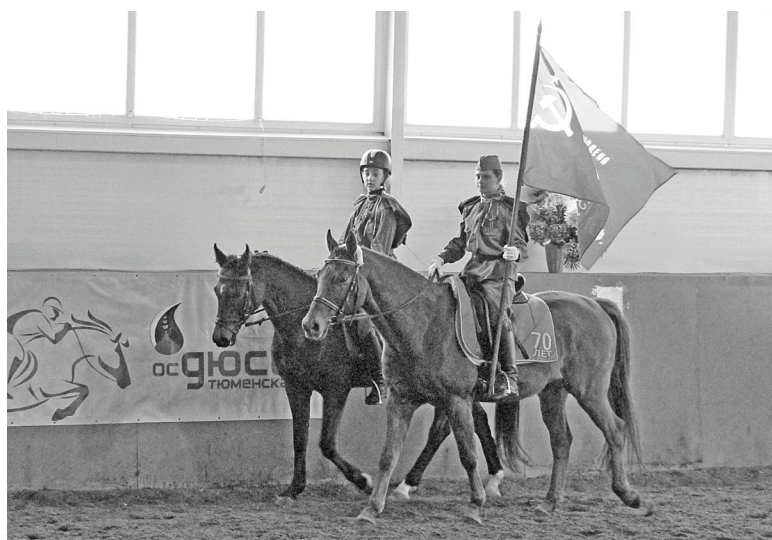
Стилизованный парад-алле, посвящённый 70-летию Победы. И всадники, и кони чувствуют торжественность момента.