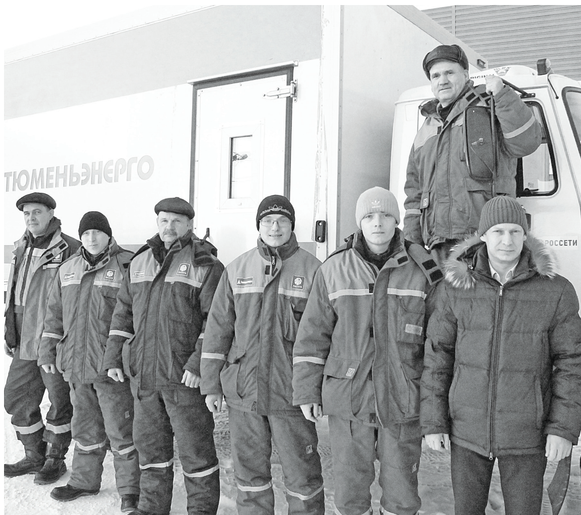
Сегодня на улице -30, но бригада готова к выезду на линию.

За состоянием электроснабжения чётко следит диспетчерская служба, а на случай каких-то внеплановых отключений круглосуточно дежурит оперативно-выездная бригада. Холод, жара, ненастье или ещё какие-то нюансы погоды – эти люди всегда готовы выехать на