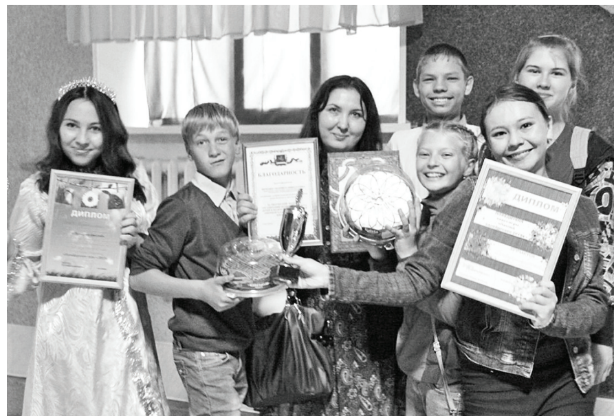
С таким руководителем любое дело под силу!