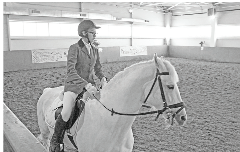
Первое испытание – выездка. Главное – побороть волнение, стать единым целым с четвероногим напарником.

во время Великой Отечественной войны командовал эскадрой 28-го гвардейского кавалерийского полка. Был удостоен звания Героя Советского Союза. После войны работал директором Тюменской госконюшни – ипподрома, директором колхозов «Победа» и «Новый путь», городского ипподрома. Кавалер орденов Ленина, Красного знамени, Александра Невского, Отечественной войны I степени, двух орденов Красной звезды, отмечен серебряной шашкой, имеет звание «Почётный гражданин Тюмени».