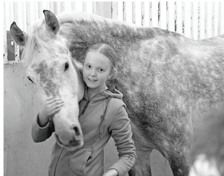
Перед началом соревнований нужно подбодрить своего верного друга.

После приветственных слов главного судьи соревнований и представления судейской коллегии участники стали готовиться к состязаниям, а гости мероприятия с нескрываемым