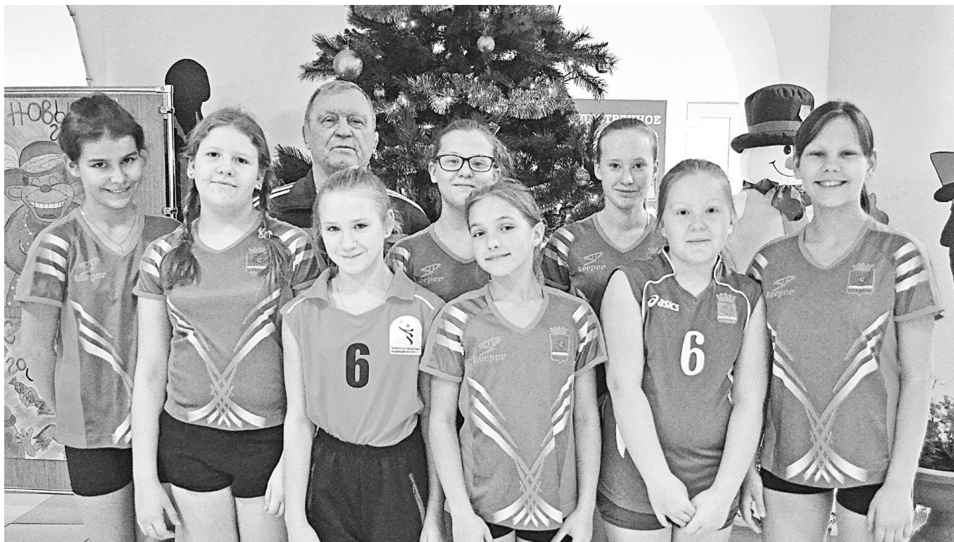
Наши умницы! Наши красавицы!

В начале декабря в областном центре прошёл волейбольный турнир на призы волейбольного клуба «Тюмень». Надо сказать, что, несмотря на дебют, наши девочки 2004-2005 годов рождения нисколько не оробели и дали настоящий бой команде Тюменского района и четырём городским сборным.