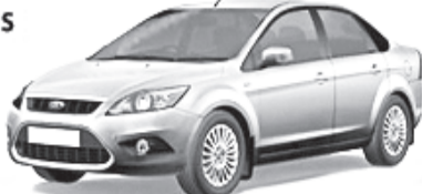
ТОП-10 российских марок с пробегом