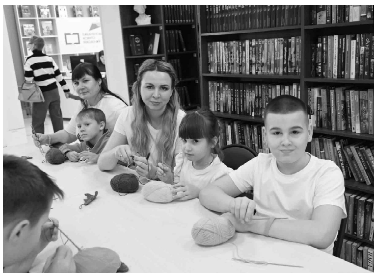
На интерактивной площадке «Семейный клубок» дети и родители учились вязать на спицах

- Очень довольны, что интересно провели выходной. Мастер-классы были один лучше другого. Успели побывать на лепке пельменей, вязании ковриков. Елочную игрушку раскрашивали. Пластиковые шарики с узорами из гуаши будут оригинальным украшением к празднику и напоминанием о хорошей компании.