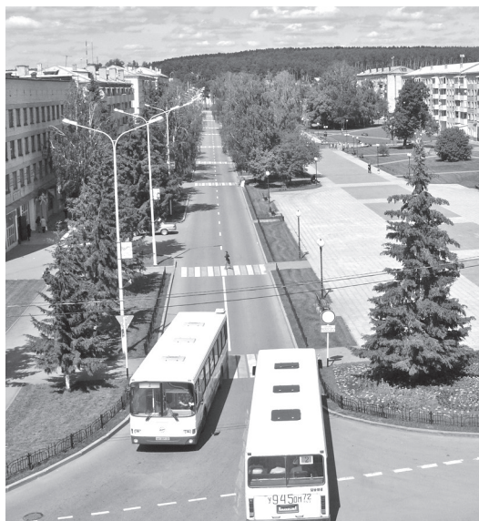
• 60 лет назад в Заводоуковске было организовано автобусное движение.