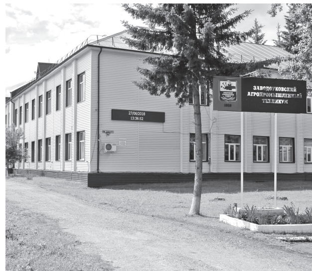
• 25 января 1959 года было образовано среднее профессиональное учебное заведение (сейчас Заводоуковский агропромышленный техникум).