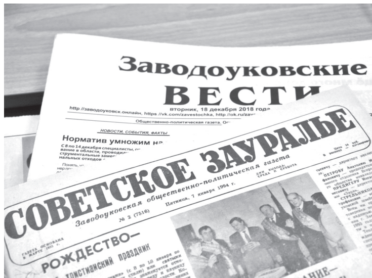
• Четверть века назад, в феврале 1994 года, районная газета «Советское Зауралье» сменила название на «Заводоуковские вести».

Отдел по делам архивов администрации Заводоуковского городского округа