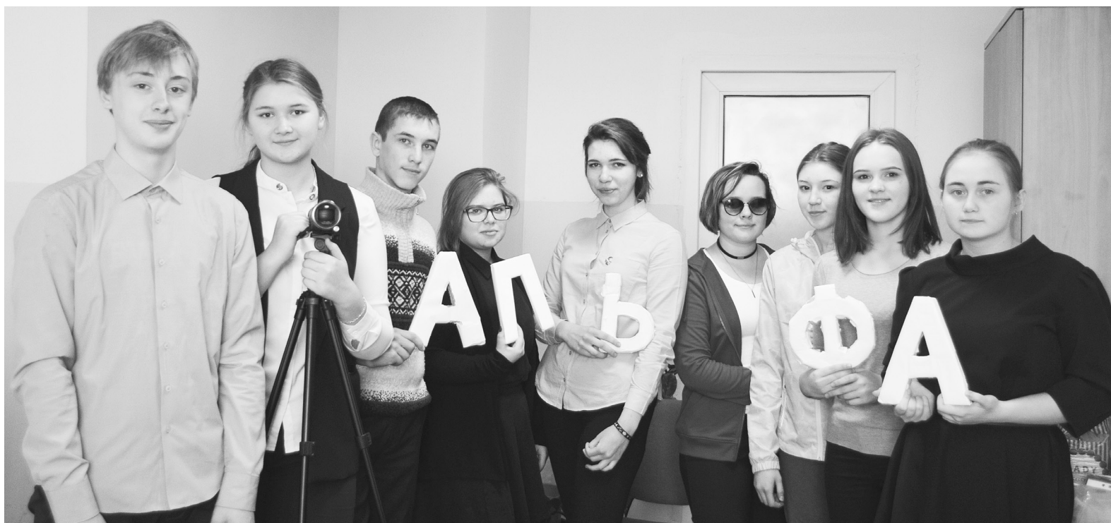
Творческий коллектив студии «Альфа» готов поделиться интересными идеями.

– Некоторые идеи нам подкидывают учителя, некоторые возникают в наших головах, а содержание фильмов мы разрабатываем самостоятельно. Работы «От букваря до аттестата», «Самый лучший день», «Один день в лагере» и «Фильм о фильмах» – наши авторские задумки.