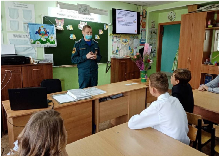
Урок безопасности в ВСШ № 1

В первый день нового учебного года согласно доброй традиции и в рамках месячника безопасности детей сотрудники ОНДиПР по Викуловскому району и 131 ПСЧ с. Викулово принимают участие в проведении Дня знаний с учащимися образовательных учреждений и проводят занятия по соблюдению мер безопасности жизнедеятельности. Так что нарядные школьники, кроме торжественных речей педагогов, получили доброе напоминание и от сотрудников МЧС. Стоит отметить, что время проведения подобных занятий выбрано не случайно. Многие дети вернулись с отдыха и уже подзабыли правила безопасности, которые нужно соблюдать, чтобы не подвергать свою жизнь опасности. Поэтому сотрудники МЧС в очередной раз напомнили ребятам правила безопасного поведения, а также единый номер вызова экстренных служб «112», если беда вдруг случится.