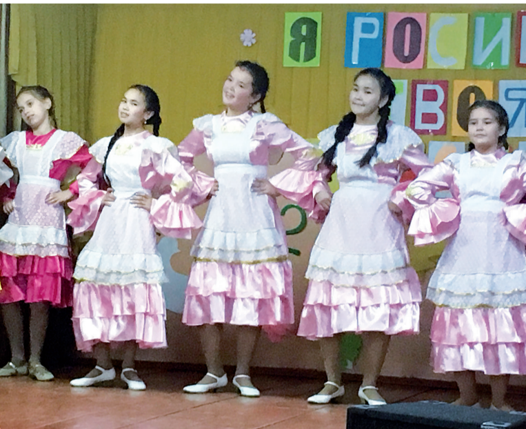
подготовила КЛАРА КУТУМОВА

Хмелёвское поселение по праву называют и спортивной территорией. На протяжении нескольких лет оно в числе лидеров по многим