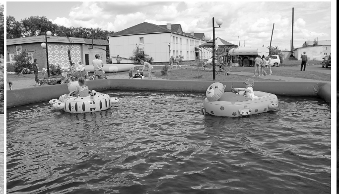
* Чего только не было на площади, чтобы ребята было весело!