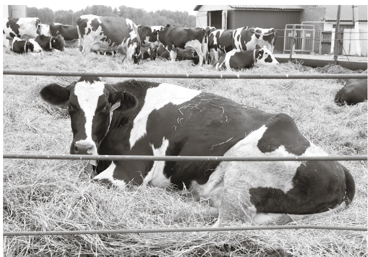
* И в летний сезон никулинские бурёнки получают консервированные обеды.

На отделении побывала Елена ДАНИЛЬЧЕНКО