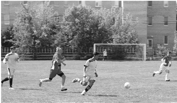
* Сладковские спортсмены в праздник принесли две победы району.

На юбилейных торжествах побывала Елена ДАНИЛЬЧЕНКО