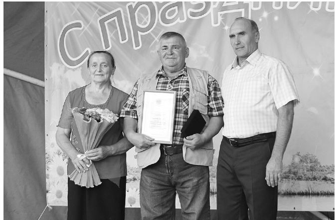
* Поздравления принимают супруги Кугаевские.