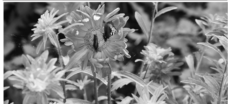
* В августовский денёк.