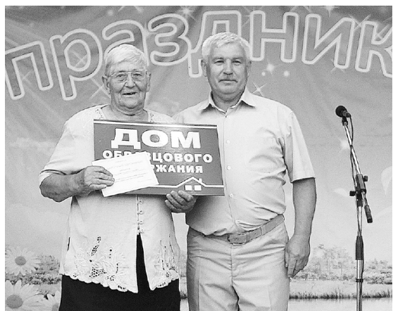
* Усадьба В.П.Некрасовой – одна из лучших в селе!