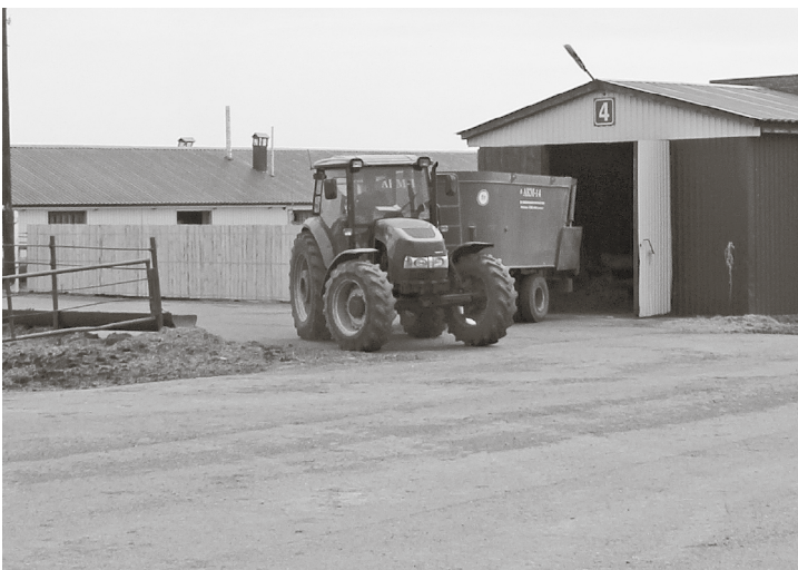
* Кормораздатчик успевает объехать все фермы.