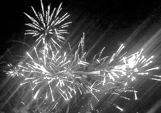
* Яркий фейерверк поставил точку в юбилейных торжествах!