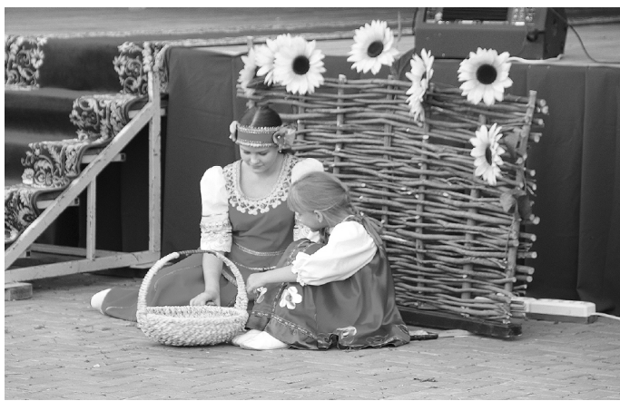
* Начало праздничной программы было организовано в русском стиле.