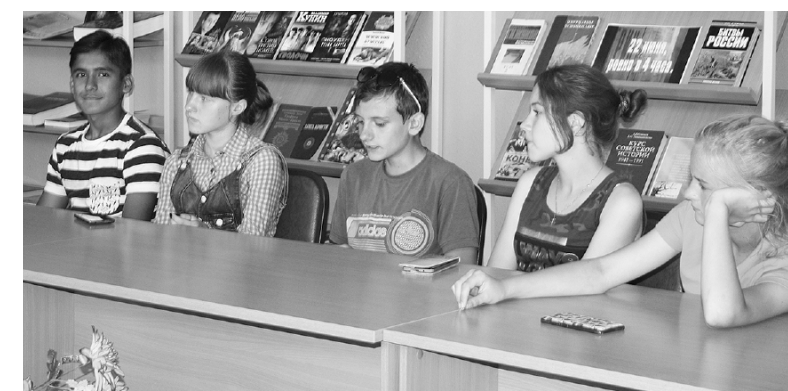
* На мероприятии ребята узнали много полезного.

внёс он в нашу жизнь, и какие последствия могут быть от постоянного сидения за компьютером. Далее были рассмотрены такие опасности как преступники в Интернете, вредоносные программы, азартные игры, интернет-хулиганство и т.д.