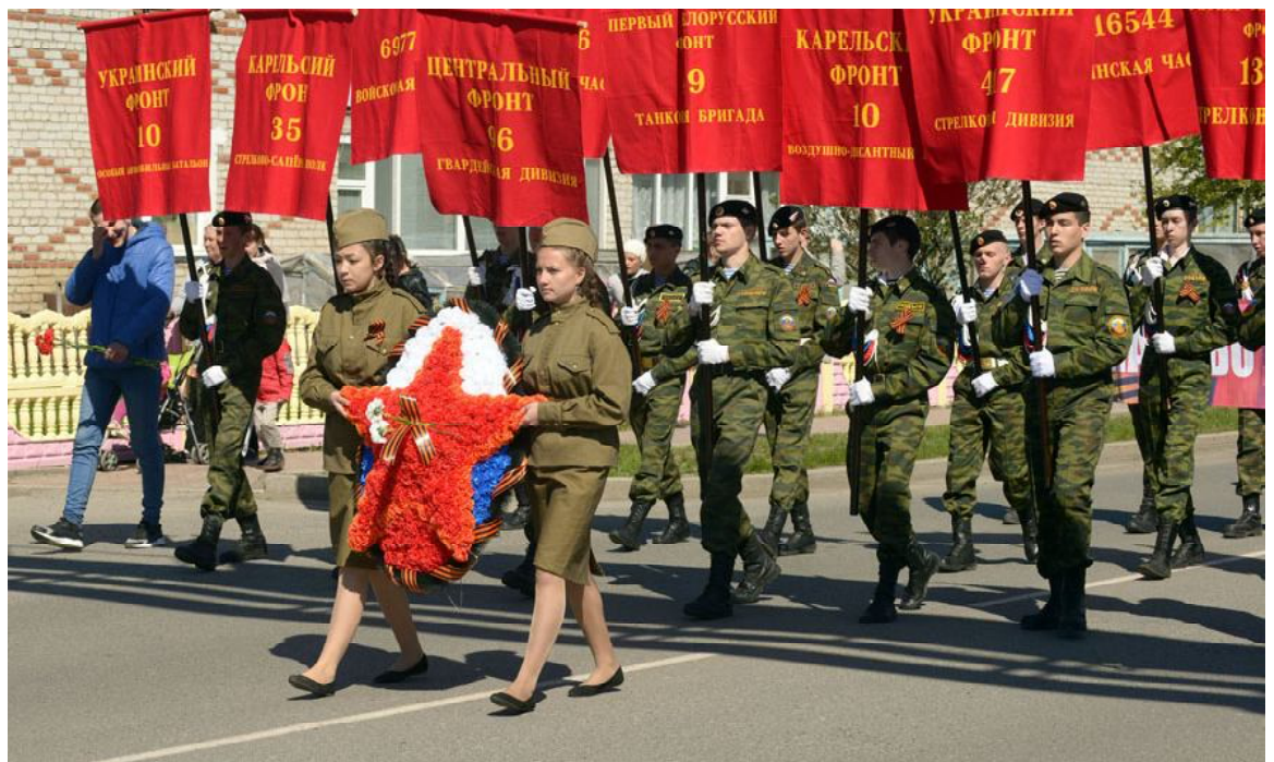
Фотографии А. САУТИЕВА с празднования Дня Победы 2016 года