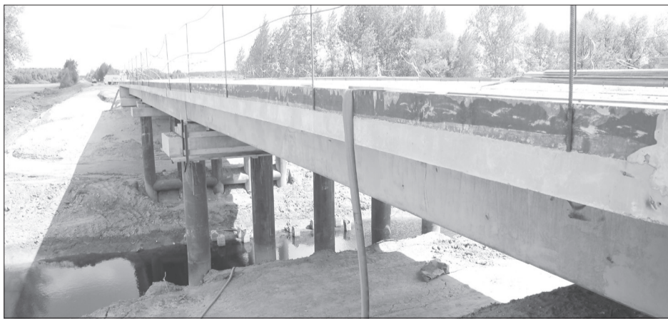
Мост над рекой Кололуй, пожалуй, самый протяжённый и ресурсоёмкий

мощным плитами. Это немного замедляет темп передвижения машин на трассе. Водители легковушек в соцсетях жалуются, что большегрузы вдавили плиты в землю, создав неудобные перепады высот.