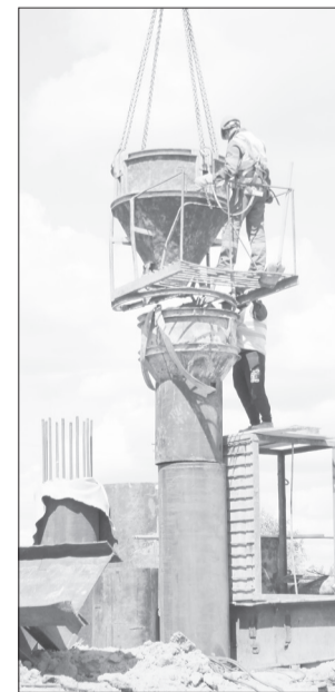
Все меняют полностью, а сначала монтируют сваи пролёта, как здесь, на реке Чакче