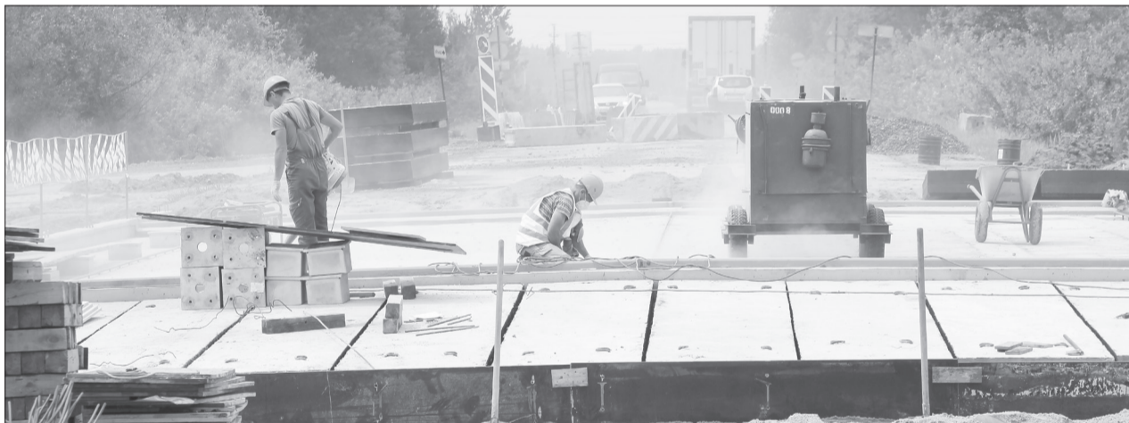
Движение транспорта во время ремонта не прекращается, но машины пустили в объезд

Для безопасности. Участок магистрали Исетское - Ялуторовск - Ярково фактически соединяет юг и север Тюменской области. Он относится к дорогам регионального значения. Работы на мостах в разных стадиях выполнения, но везде заново отсыплют подходы, укладывают новое перекрытие на свайных опорах, затем будут асфальтировать. Генеральные подрядчики имеют право привлекать субподрядчиков, поэтому каждый занимается тем, на чём специализируется: мостостроители - мостами, дорожники - магистралью. Поток транспорта сейчас временно идёт по заранее оборудованным объездам, вы-