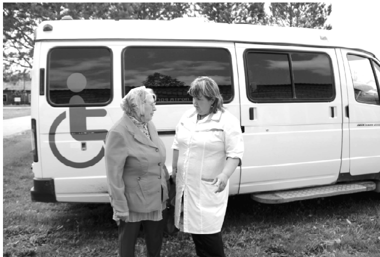
➤ Автопоезд «Здоровье» в Боково