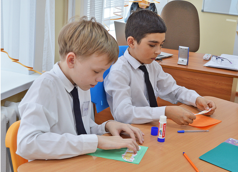
Внешний вид школьника должен соответствовать общепринятым нормам делового стиля