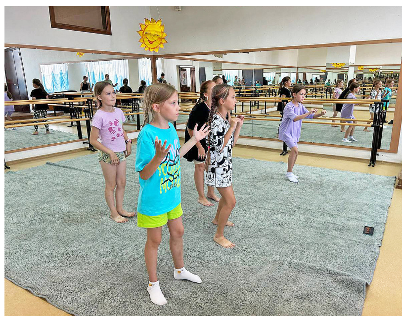
Воспитанники лагеря «Творческая школа» любят танцевать и делают это каждый день