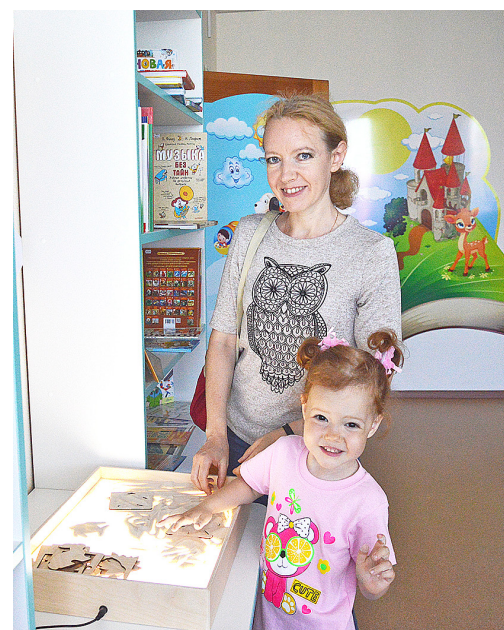
В интерьер детской библиотеки удачно вписались световые песочные планшеты для занятий с детьми

для детей и подростков, где функционирует интерактивный пол, и отдельный зал «Игротека» – для малышей. Юные посетители мо-