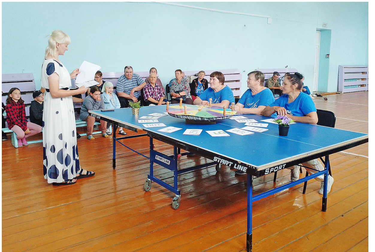
Участники интеллектуальной игры получили призы и хорошее настроение