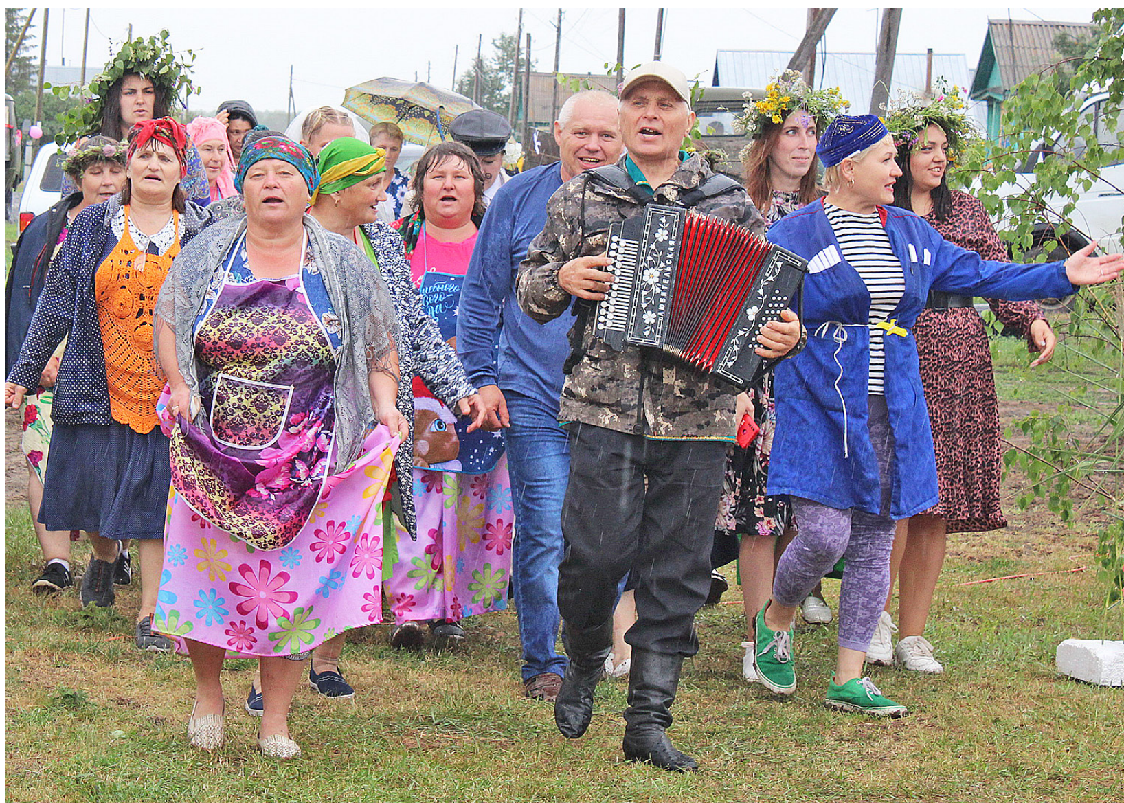
Праздник в деревне – незабываемое событие для её жителей

Жители Дальнетравного 23 июля отметили 235-летие со дня образования деревни