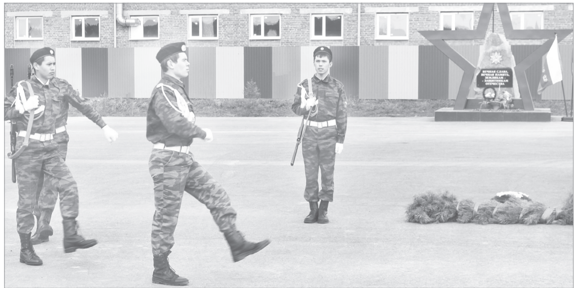
Умение чётко маршировать и слаженно выполнять строевые команды - одна из главных задач почётного караула