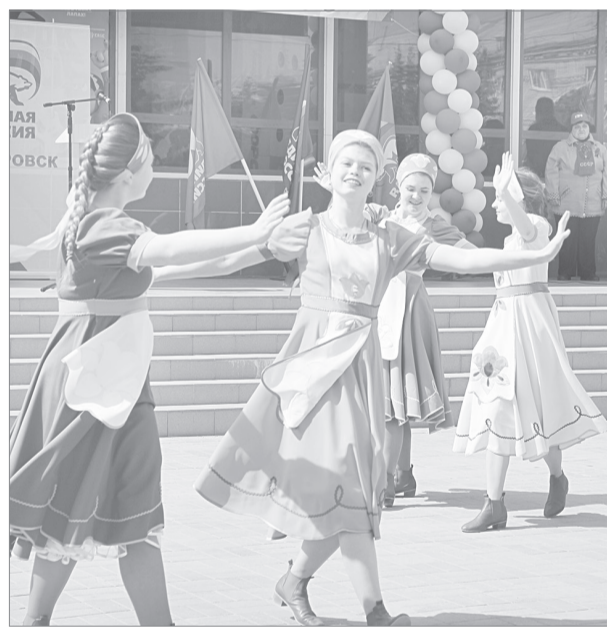
В вихре танца кружит май... и девушки из ансамбля «Гаврош»

Праздник Весны и Труда продолжился в городском саду, где традиционно в этот день состоялось открытие сезона.