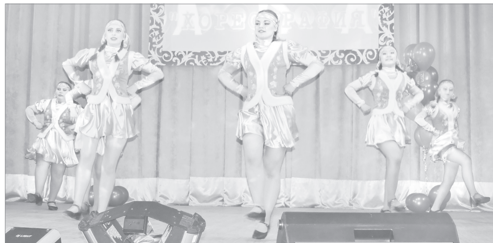
Танцевальный ансамбль «Марина» из Старого Кавдыка не в первый раз участвует в фестивале «Лестница успеха»