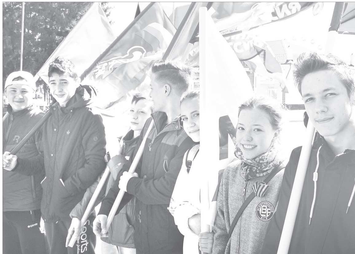
Нам, молодым, строить город наш родной! - говорят молодоговардейцы Ялуторовска