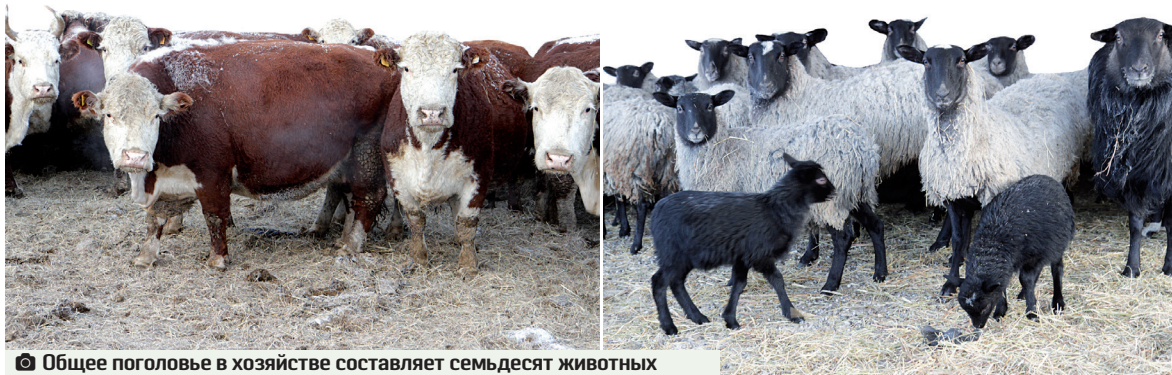
Общее поголовье в хозяйстве составляет семьдесят животных