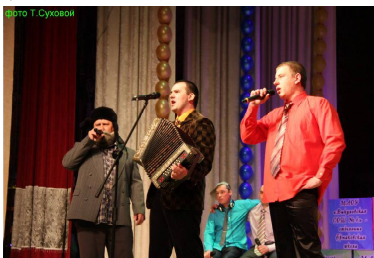
» Частушки от ПАТ.