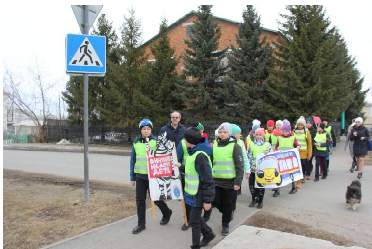
➤ Акция «Шагающий автобус» в Викулово

«Прямыми тротуарами, По одному иль парами, Дорогою знакомою От школы иль от дома Идём путём любимым. Машины мчатся мимо...» Получив все напутствия, «Шагающий автобус» двинул-