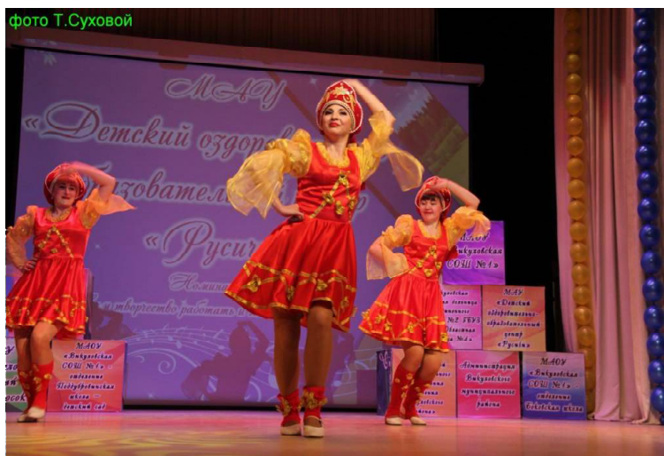
» «Русичи» танцуют.

«отправились на Север» в поисках талантов. Все же на Север едут, значит, там лучше? Но, оказывается, ехать никуда не нужно, а таланты и счастье здесь, в нас самих, на родной земле.