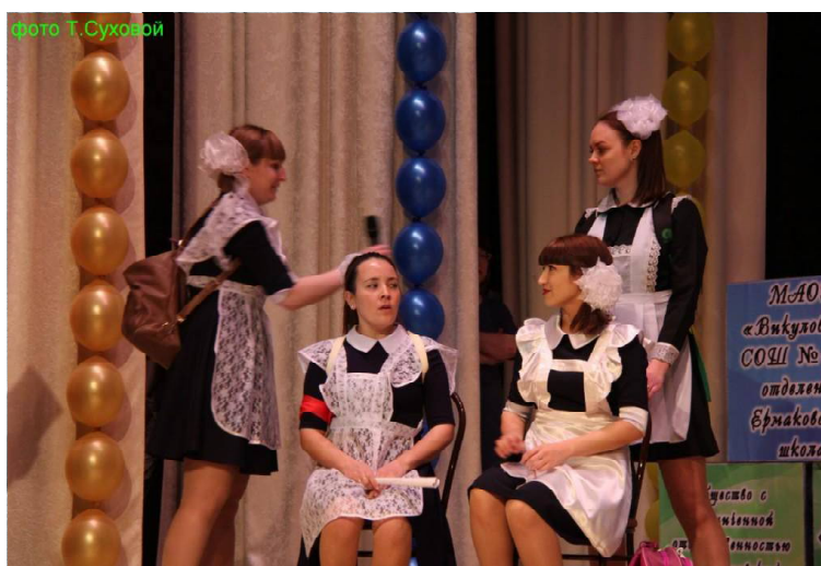
» Выступает ВСОШ №1.