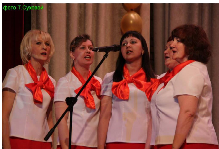
» Поёт коррекционная школа.