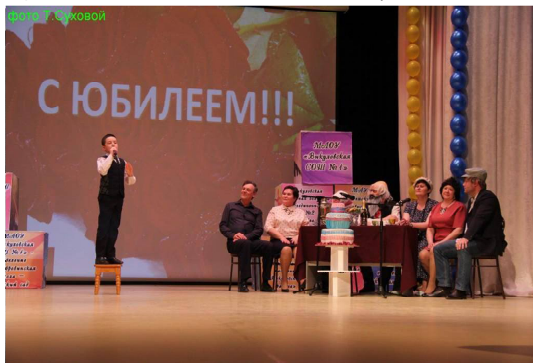
» Администрация района.