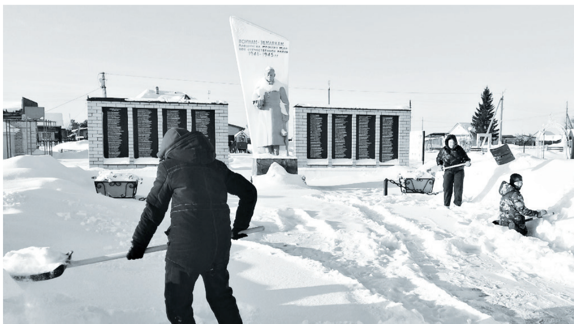
Суерские восьмиклассники наводят порядок у памятника героям-землякам.