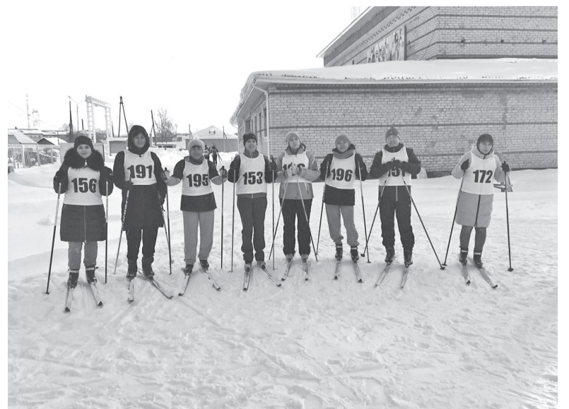
На лыжной трассе