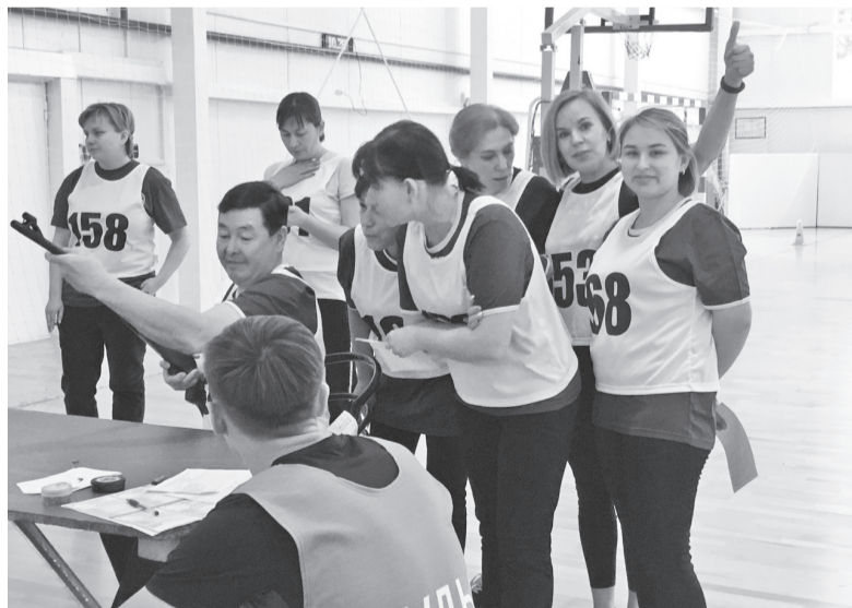
Вагайские педагоги сдают нормативы комплекса ГТО

После напутственных слов организаторов соревнований спортсмены отправились демонстрировать уровень своей физической подготовки и умение стрелять из пневматической винтовки. Большую помощь в организации фестиваля оказал