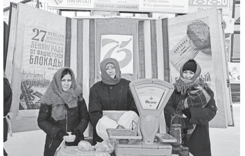
Здесь выдавали суточный паек «блокадного хлеба»

Всероссийская акция «Блокадный хлеб» открыла Год памяти и славы – год, когда мы вспоминаем людей, пожертвовавших своей жизнью ради мирного неба над головой.