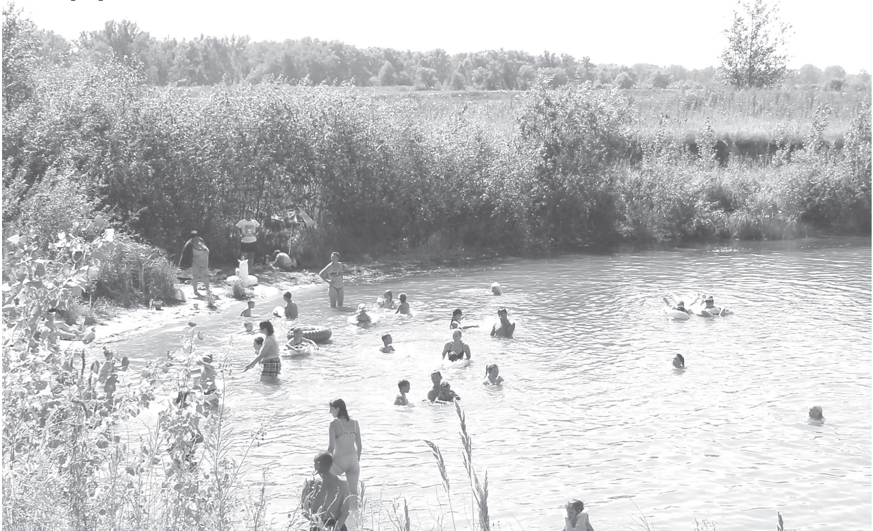
Представители ГИМС напоминают, что купаться в несанкционированных местах запрещено